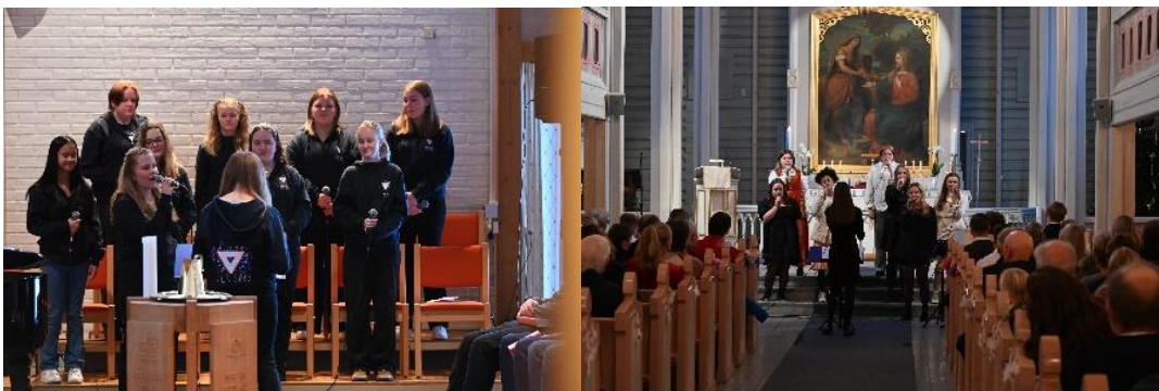
Ung messe i Mjøndalen kirke Julegudstjeneste i Nedre Eiker kirke

En viktig del av arbeidet i NETS er oppfølging av ungdomsledere og samlinger for voksenlederne. 5 NETSere ble sendt på TenSing Seminar til Ulsteinvik på direksjon, tangenter og styrelederkurs i begynnelsen av august. NETS er helt avhengig av ledertrening, for å dyktiggjøre ungdommene til tjeneste i kor, band, lyd og lys. For oss er det viktig med ungt engasjement og voksen medvirkning.