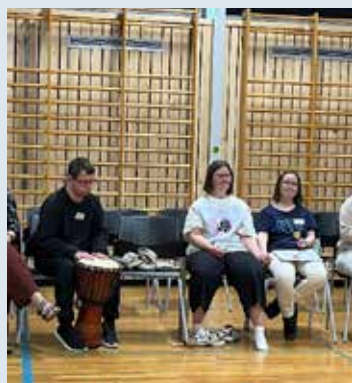
Venner på musikkverksted