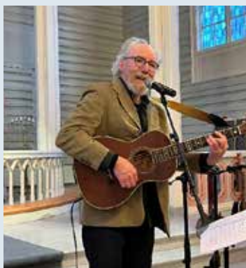
Konsert med Tore Thomassen