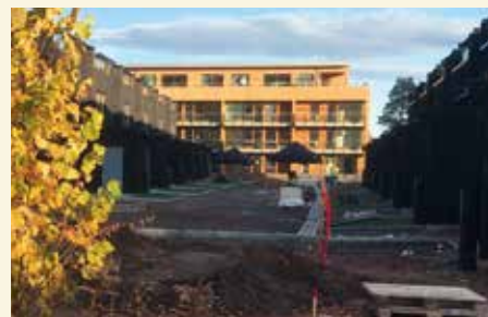
Området der tilbygget med garasje mm var.