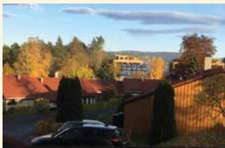
Området der eplehagen var.