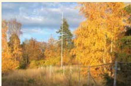
2000: Alt som er igjen der gården sto er, som dere ser på bildet, flaggstangen.