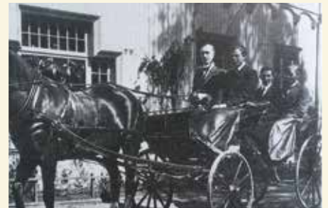
Et glimt fra Nøstet hovedgård