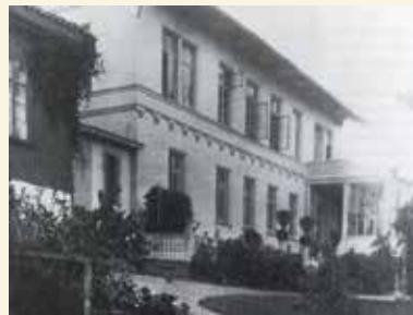
Nøstet – havesiden