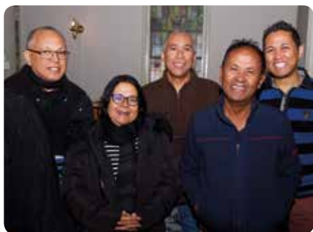
En glad arbeidsgjeng fra Madagaskar.

Tangen kirkes orgel fra 1952 ble delvis plukket ned i fjor høst av firmaet van Vulpen som skal bygge det nye orgelet. Resten av det gamle orgelet ble i overgangen januar/februar pakket forsiktig ned og fraktet til sitt nye liv på Madagaskar (!). Tangen menighet er glade for at det gamle orgelet kan få et nytt liv i en menighet som sårt ønsker seg orgelklang til gudstjenestefeiringene sine.