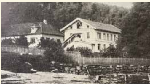
Nøstet – sjøsiden

Hvis jeg vandrer Nordbyveien mot byen og forsøker å få med de store gårdene i et slags geografisk rekkefølge, burde jeg nå stoppet ved Nordre Solum. Store Solum har jeg skrevet om, men det er ikke alltid jeg klarer å få kontakt med de personene jeg gjerne vil samtale med. Derfor blir det Nordby gård som får min oppmerksomhet i dette nummeret av Menighetsbladet. I neste nummer håper jeg å kunne fortelle om Nordre Solum.