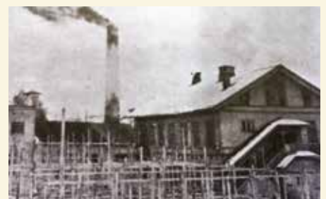
Høsten 1949 ble hovedhuset på Nøstet hovedgård revet.

I dag har vi konkrete minner om ham i Jens Grams vei og Grams allé .