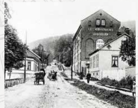
På hjørnet av arbeiderboligen skimtes gjerde som var rundt kirkegården.

Ta gjerne en tur til våren, og bli kjent med denne historisk minnerike kirkegården.