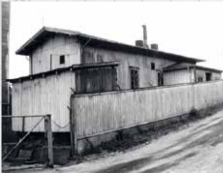
Lasarettet, Støperigaen 19, var i bruk under epidemiene.

Det eldste området som ble tatt i vanlig bruk på kirkegården ligger på venstre side av det gamle gotiske kapellet fra 1876. De eldste gravminnene som fortsatt finnes er fra 1850-tallet. Tangen kirkegård fikk ganske tidlig benevnelsen «pestkirkegården», og et område lengst vekk fra porten inn til kirkegården fikk tilnavnet «kolerastøkket».