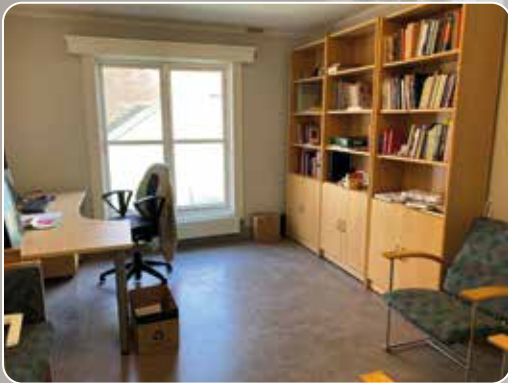
Marit sokneprests kontor.