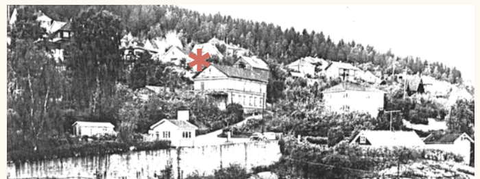
Arbeiderboligen ved Veveribakken.