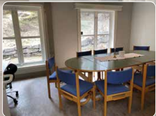
Barnehagerommet er omgjort til møterom.

I juni 2020 vedtok Drammen kirkelige fellesråd at Tangen menighetskontor skulle ut av Strømsø menighetshus. Strømsø kirke skulle tas ut av ordinær drift. Det ble til slutt bestemt at 2. etasje i Tangen Arbeidskirke skulle benyttes til menighetskontorer. Her ser dere resultatet. Velkommen inn!