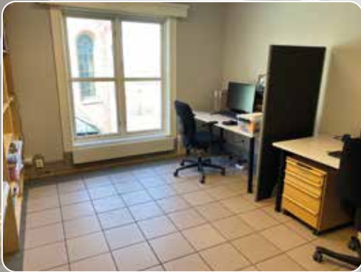
Linda kirketjener/ungdomsarbeider skal dele kontor med ny kateket.