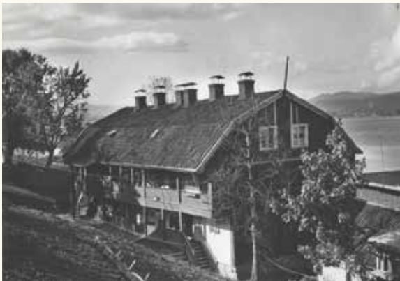
Støperibrakka, også kalt «Brakka».

Nederst i Støperigaten, nær Sota, lå Støperibrakka, kalt « Brakka ». Den inneholdt 12 leiligheter, hver med ett rom og kjøkken. Det var sikkert trangt om plassen for store familier. På loftet fantes 4-5 små hybelrom.