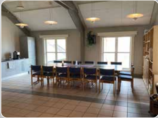
Peisestua har blitt mer koselig og intim, med kjøkken til venstre.