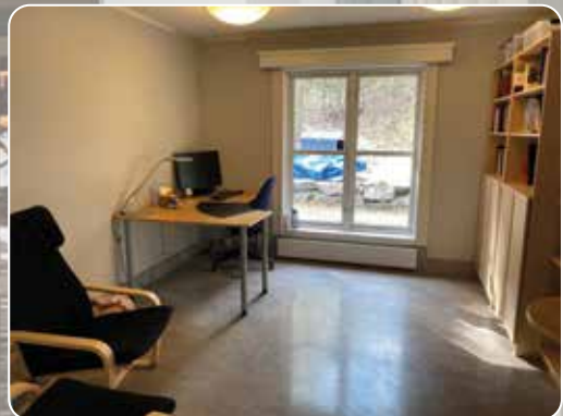
Prest Olas kontor (det gamle biblioteket)

I juni 2020 vedtok Drammen kirkelige fellesråd at Tangen menighetskontor skulle ut av Strømsø menighetshus. Strømsø kirke skulle tas ut av ordinær drift. Det ble til slutt bestemt at 2. etasje i Tangen Arbeidskirke skulle benyttes til menighetskontorer. Her ser dere resultatet. Velkommen inn!