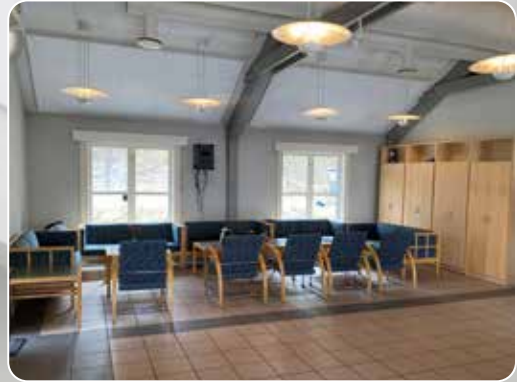
Stab og menighetsråd er veldig godt fornøyd med de nye lokalene og staben er glade for å være i kirken.