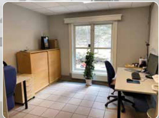
Her holder Grøa organist og Siv menighetsarbeider til.