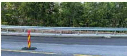
Rester av grunnmuren av Finlandsbrakka.

Ingen av fabrikkene jeg har skrevet om, er i drift i dag og det eneste som fortsatt finnes, utenom restene av de gamle fabrikkbygningene her på Glassverket, er portnerboligen «Sverige» som ble benyttet som kontor. Den står falferdig nede i bakken på venstre side av Svelvikveien når en kjører utover. Den skal sikkert rives når hele området blir en av de nye «bydelene» med bla terrasseleiligheter ved sjøen.