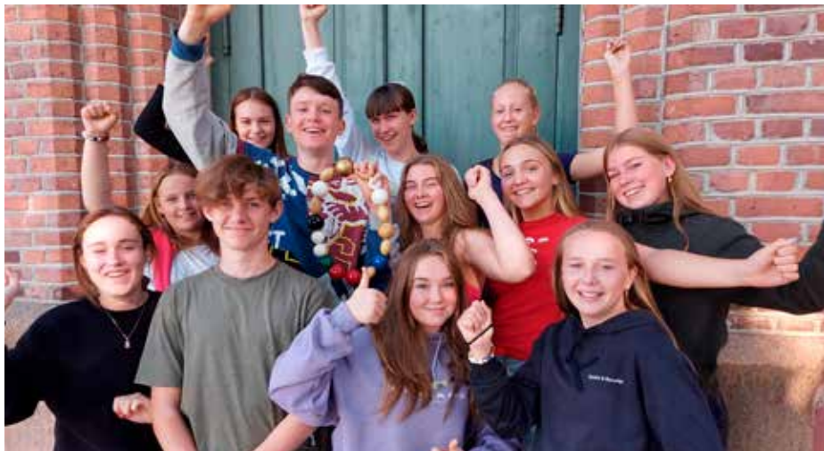
Glade konfirmanter etter konfirmantleir.

Lørdag var konfirmantene pilegrimer og fikk fylle Kristuskransen med eget innhold og erfaringer gjennom en vandring som gikk fra Tangen kirke – Nordbykollen – Tangen kapell og Sota.