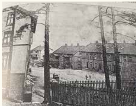
Arbeiderboligene på Glassverket, fra venstre: Finland, Norge og Skandinavia. Gjengitt fra et gammelt postkort.

gjorde området yrende av liv, for ikke bare arbeiderne bodde der, men hele familier.