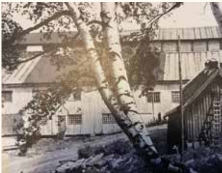
Linnebrakka, navnet er muligens et resultat av at linveveriet lå der tidligere.

I forrige nummer avsluttet jeg med fortellingen om arbeiderboligen som lå nederst i Veveribakken. Jeg har ikke funnet noe eget navn på arbeiderboligen, men fabrikken hadde også egen spisebrakke som ble kalt «Linnebrakka». Videre i denne utgaven av Menighetsbladet får Glassverket og alle arbeiderboligene der plass. En liten bit av grunnmuren på Finland kan en fortsatt se utenfor rekkverket tett inntil ved den nylagde biten av Svelvikveien ved den gamle fabrikken.