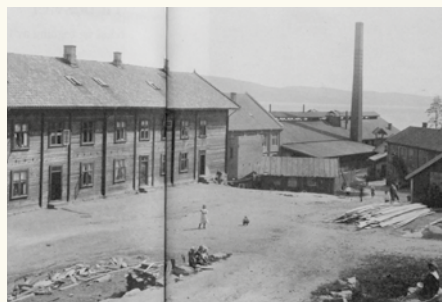
På bildet til venstre arbeiderboligen Skandinavia fra 1898. Du skimter Svenskebrakke nederst til høyre. Bildet til høyre er et nærbilde av Svenskebrakke med utvendig trapp.