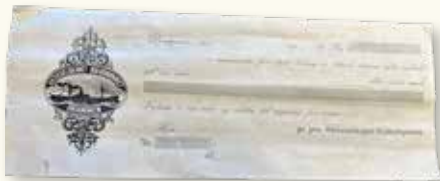
Gammel veksell med aksjeselskapets spesielle logo til slikt formå.

For de nye industribedriftene ved elvebredden med egen kai var det mulig å få fraktet kull, koks og annet gods med båt frem til bedriftene. Kulkompaniet med sin beliggenhet med egen kai, etablerte da AS Transport. Denne bedriften med sine 50 lektre og 13 slepebåter leverte varer opp og ned langs elven. Denne virksomheten drev de til 1967, da hadde lastebiler overtatt transporten mer og mer og AS Transport opphørte.