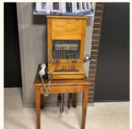
Viktig ny installasjon i en stor bedrift med mange avdelinger.