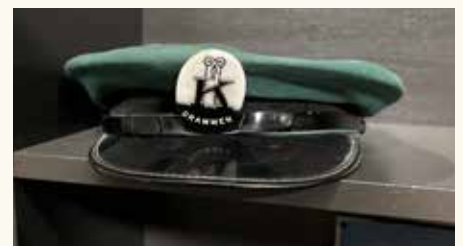
Godt synlig skulle de ansatte være.