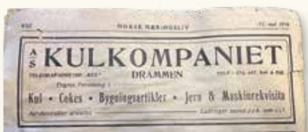
Annonse i Norsk Næringsliv, 1918.

Gaasevadet blir startstedet for denne min vandring videre inn over Strømsø bydel.