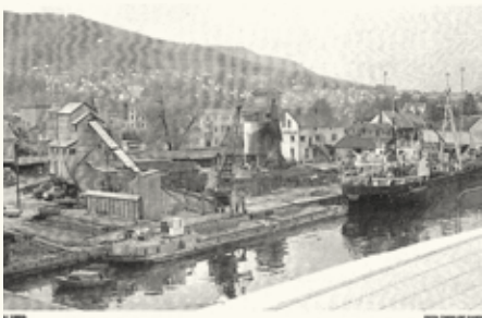
Kulkompaniets egen kai mot havnen.