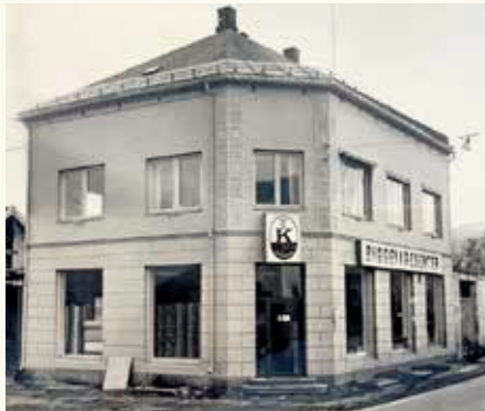
Bedriftens bygg mot Mads Wiels plass med den flotte logoen over døren.

I 1905 ble det grunnlagt en papirfabrikk her, den fikk navnet Gaasevad Papirfabrikk. Den var starten på det som senere ble bedriften som mange av oss kjenner under navnet Star Paper Mill. I dag kan dere her ved Rundtom, like ut mot gateløpet i Tollbugata, se et hus som ble bygget i 1909. Om dette huset var en del av Gaasevad Papirfabrikk, vet jeg ikke, men det er et av de få husene som i dag finnes i området fra den tiden.