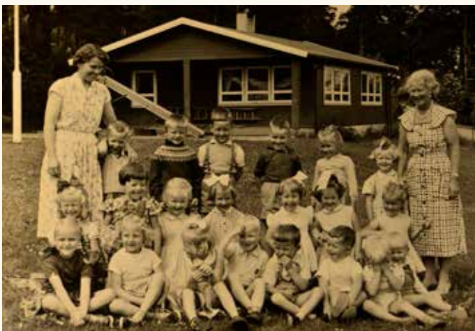
Barn og voksne foran barnehagebygningen fra 1954.

Den inneholder historiske dokumenter, som byggekomiteens protokoller, sirlig håndskrevet og tatt vare på fra første spadetak i juni 1953 til barnehagen sto klar til innvielse 25. januar 1954. Bemerkesverdig er det at barnehagens innvielse ble feiret dagen etter at Tangen kirkes 100 års dag ble feiret.