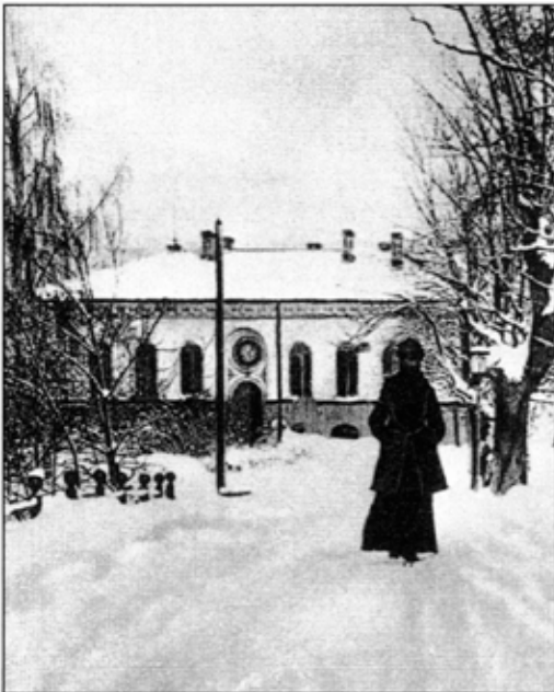
Tollboden fra 1877 og broen til Ankerøen,