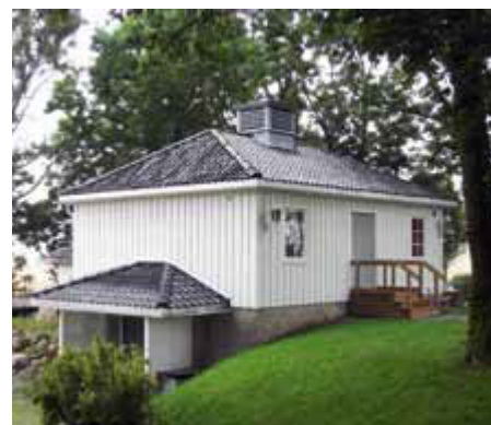
Kirkestue/bårhus ved Frogn kirke er ferdig pusset opp.

Det skjer mye med fornyelse og istandsetting av kirkens eiendom i Drøbak og Frogn og vi er glade for den velvilje våre planer har møtt hos så vel Frogn kommune som andre myndigheter som er involvert. Kirkene og kirkegårdene i Drøbak og Frogn er mye brukt og betyr åpenbart mye for mange. Det er derfor viktig at de vedlikeholdes og framstår som pene og ordentlige.