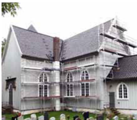
De utvendige arbeider på Drøbak kirke er snart igang.

Det er avsatt og godkjent gravplasser for muslimer på Frogn kirkegård. I denne forbindelse har vi i løpet av våren foretatt en del ny beplantning på kirkegården. Vi har under vurdering å etablere en navnet minnelund på Frogn kirkegård