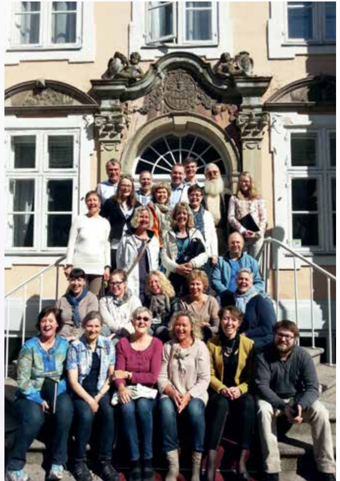
Drøbak Kantori på Danmarkstur, her foran hotellet i Horsens.