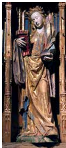
Sunniva av Selja

Av andre pilgrimsleder i Norge, kan nevnes St Sunnivalleden, fra Kinn til Selje kloster i Sogn og Fjordane.