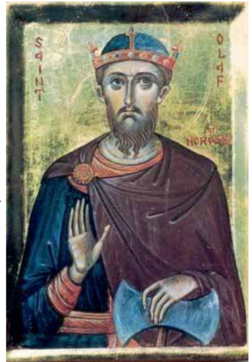
Olav den Hellige

Sunniva var en irsk kongsdatter, berømt for sin skjønnhet og rikdom. Hun rømte fra landet for å slippe å gifte seg med en hedensk og brutal beiler. Båten drev i land på norskekysten, der noen av hennes folk