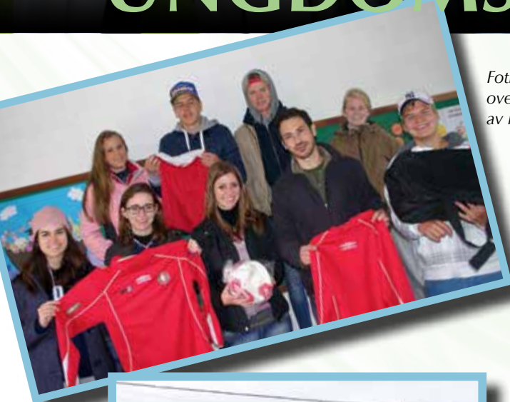
Fotballdrakter fra DFI overrekkes lederne av menigheten.