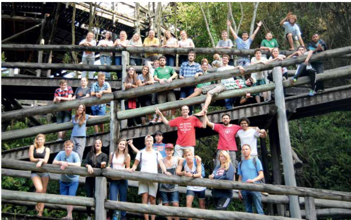
Turdag med ungdommer fra Drøbak og Frogn menighet og Redentor menighet i Brasil.

Er du interessert i å være med å starte opp et hjelpesenter for Barn og ungdom i slummen i Pestano i Pelotas i Brasil? 11 ungdommer fra Drøbak reiste dit i august og skal i ettertid informere og samle inn penger til et hjelpesenter for å holde barn- og unge borte fra rus og kriminalitet i et slumstrøk. Kan du tenke deg å være med å samle inn til dette flotte prosjektet, samt ta i mot brasilianske ungdommer som kommer på besøk til Drøbak i 2014? Send en e-post til ungdomsprest oivind.refvik@frogn.kirken.no