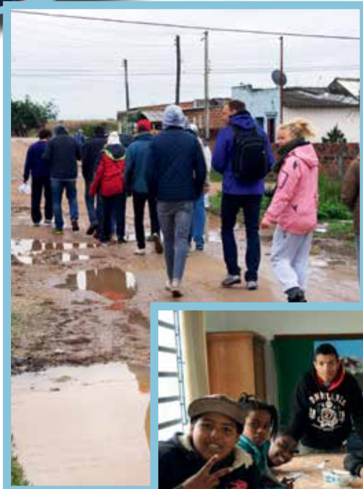
Fra slummen i Pelotas. Åpen kloakk og dårlige hus preget området.