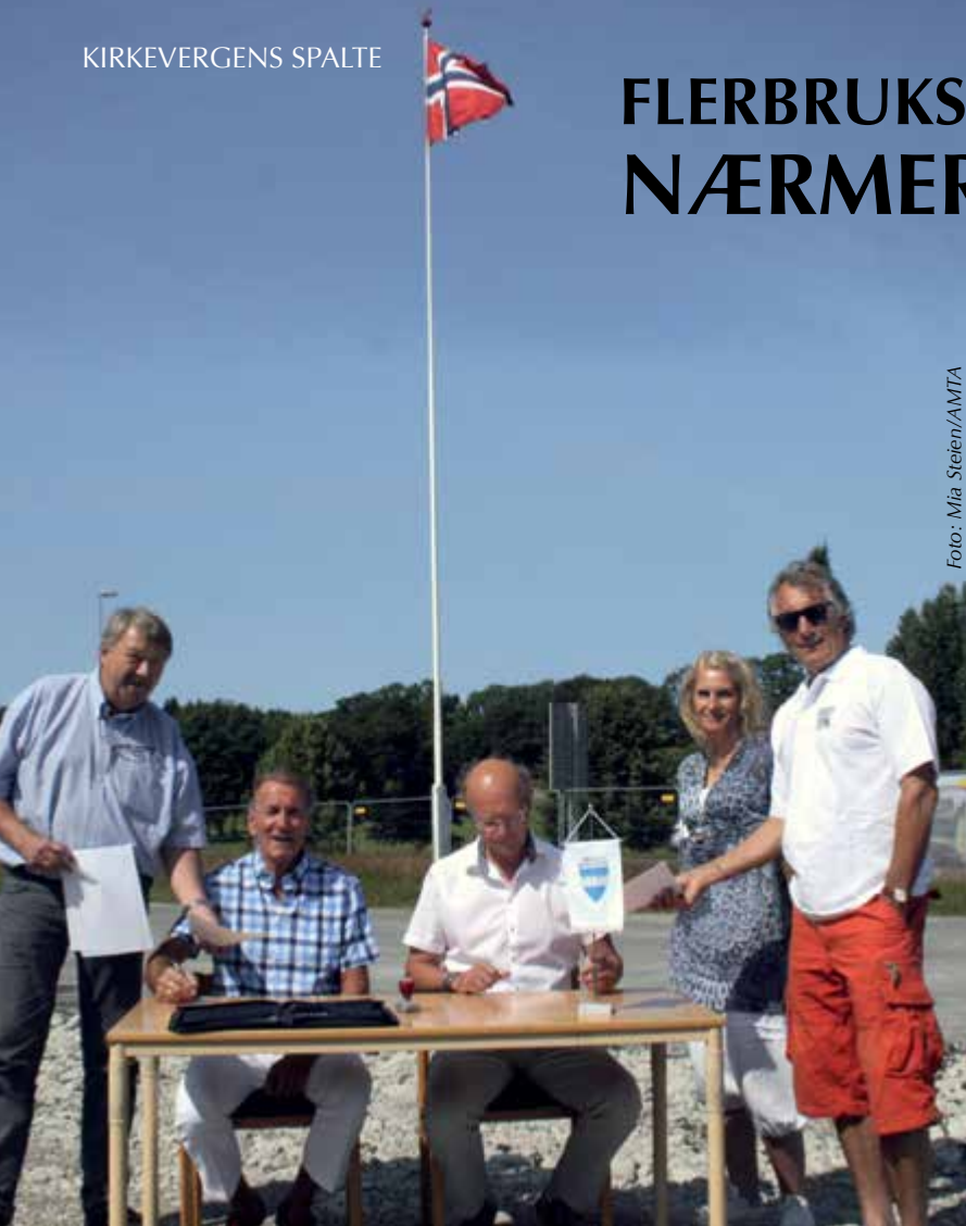
Undertegning av avtalen.

Etter at både Frogn kirkelige fellesråd og kommunestyret i Frogn i juni godkjente avtalen som et utvalg har forhandlet fram, ble avtalen undertegnet av kommunens ordfører og fellesrådets leder fredag den 19. juli. Undertegningen fant sted på tomten hvor bygget skal oppføres. Avtalen, som regulerer eierforhold, bruksrettigheter, organisering av driften og sammensetningen av et brukerstyre for huset, er en viktig forutsetning for realiseringen av det lenge etterlengtede huset som skal samle mye av kirkens og kulturens virksomhet. Samtidig vil det gi lokaler og muligheter for frivillige lag og foreninger, for kulturaktiviteter og arrangementer, og også seremonier som ikke arrangeres i kirkens regi, men av andre trossamfunn.