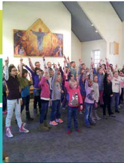
Fra barnas dag i Frogn kirke 22. april der Barnegospel, Soulchildren og Klubb for Kompiser deltok.