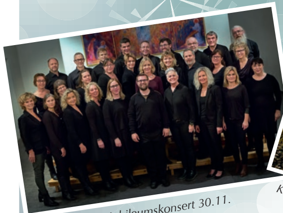
Drøbak Kantori Jubileumskonsert 30.11.

Her kan du senke skuldrene og finne ro i førjulstida. Velkommen til ADVENT 2014