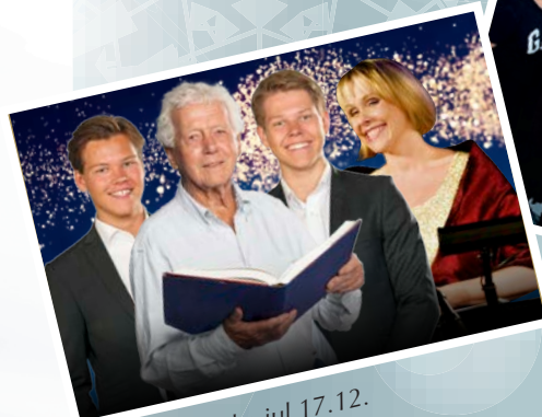
Vår klassiske jul 17.12.