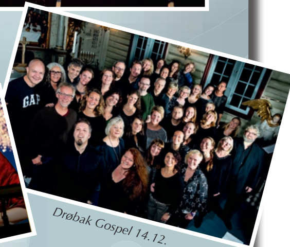
Drøbak Gospel 14.12.