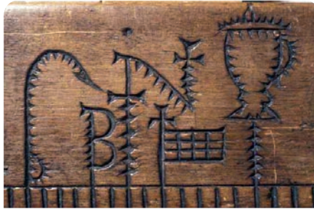
Primstav, fra Valle, Setesdal fra 1707, fra Norsk folkemuseums gjenstandssamling. 30. november Andersmesse, 4. desember Barbromesse, 6. desember Nilsmesse, 8. desember Maria unnfangelse og 13. desember Lussinatt.

I religionsvitenskapen snakker man om "farlige" tider og steder; da må man være forsiktig med hva man foretar seg, og se til at alt går riktig for seg. Desember er rik på slike farlige tider; gikk man utenom "reglementet" betydde det ulykke.