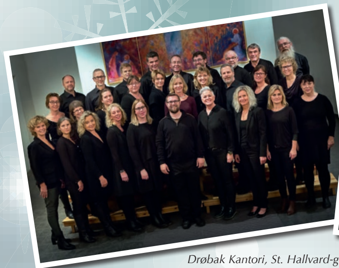
Drøbak Kantori, St. Hallvard-guttene og orkester 29.11.