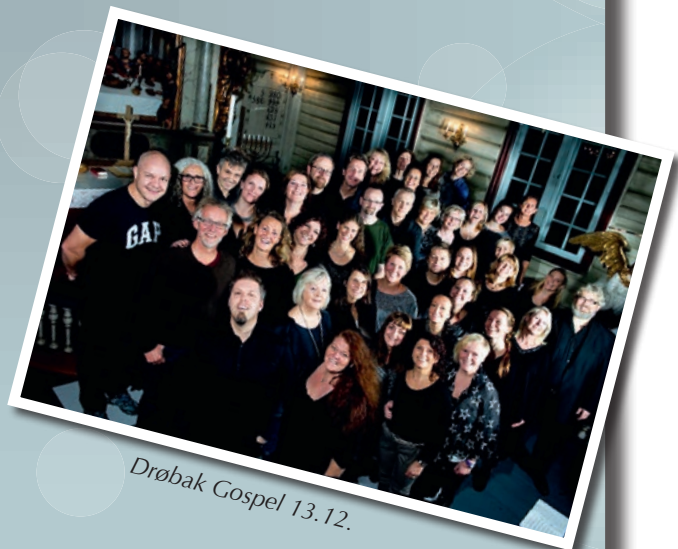
Drøbak Gospel 13.12.