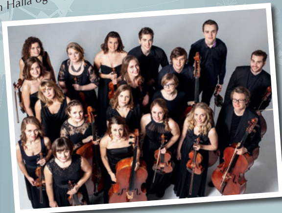
Det Norske Solistkor og Ensemble Allegria 11.12.