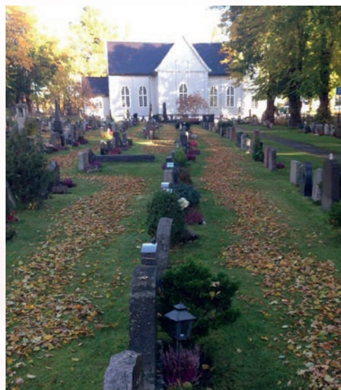
Løvet blir blåst eller raket i rader, for så å bli samlet opp av en løvsamler, og kjørt ut på komposthaugen.