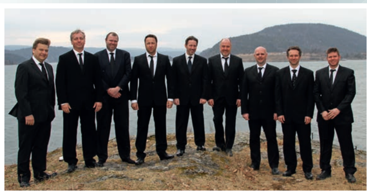
Voce Media med solister 22.12.