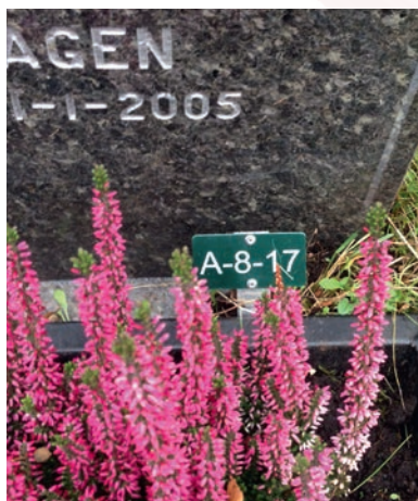
Nummerskilt på grav.