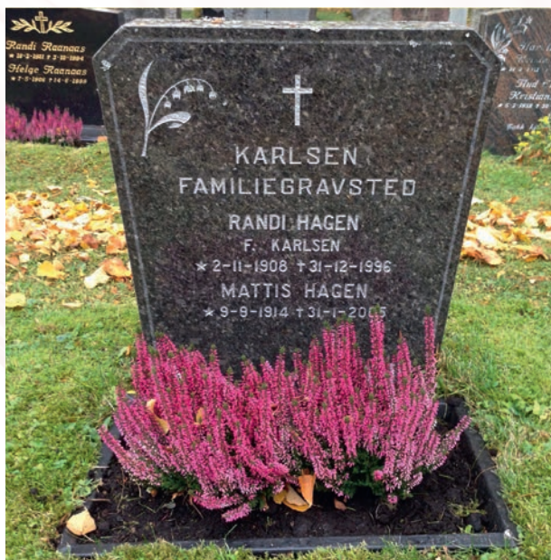
Lyngplanter på legatgrav.

Tekst og foto: Kirkegårdsarbeider Marit Andresen