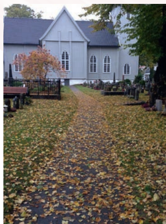
Før og etterbilde, med og uten løv.