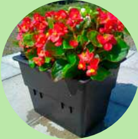
Liten rektangulær, 39 x 29 cm

Vi monterer selvvanningskasser for enkelt gravstell