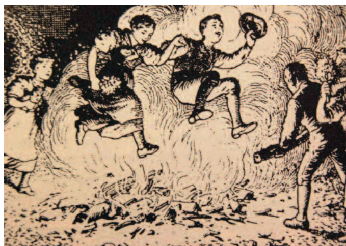
Å hoppe gjennom St Hansbålet skulle beskytte mot sykdom og ulykker.

beskyttende makt, således også Jonsokbålet; å hoppe gjennom St. Hansbålet skulle beskytte mot sykdom og ulykker. Dessuten var St. Hansnatten, sammen med julenatt, nyttårsnatt og Allehelgensaften særlig "farlige" tider, da hadde naturen en spesiell kraft. Også vann hadde en mer undergjørende virkning denne natten; syke mennesker samlet seg