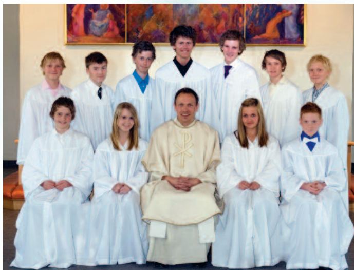
Konfirmanter Frogn kirke 2011