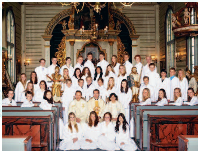
Konfirmanter Drøbak kirke 8. mai 2011