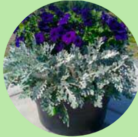
Stor buet, 49 x 29 cm

VI VASKER, BOLTER, RETTER OPP OG RESTAURERER SKRIFT PÅ GRAVSTØTTER