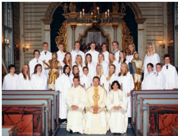
Konfirmanter Drøbak kirke 7. mai 2011