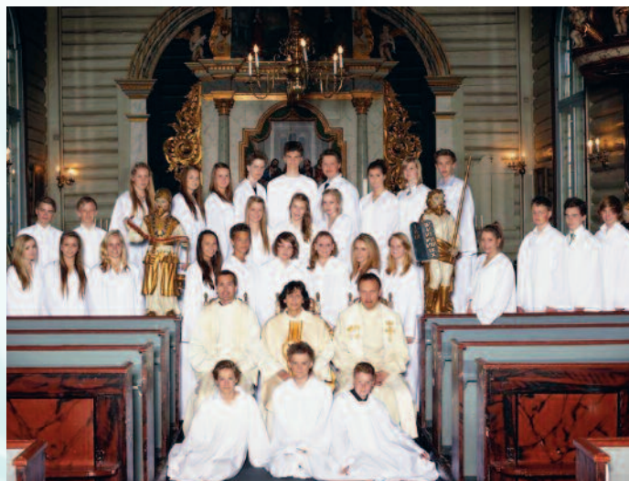
Konfirmanter Drøbak kirke 15. mai 2011