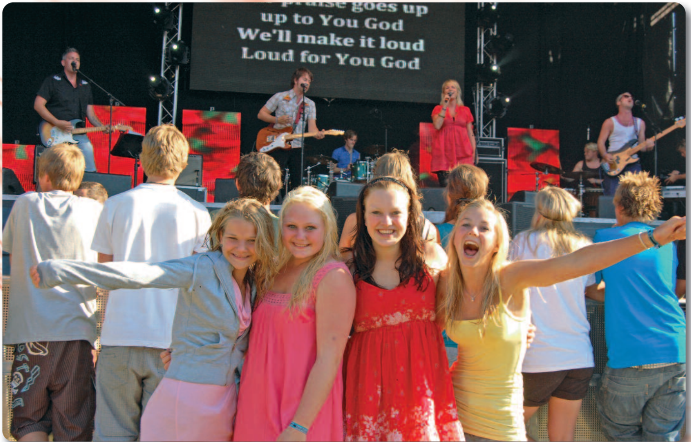
Glade sommerkonfirmanter på KonfCamp