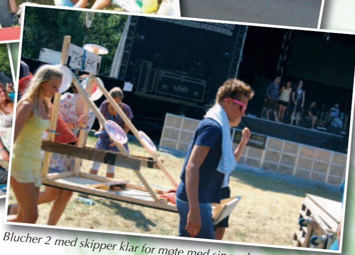
Blucher 2 med skipper klar for møte med sin undergang.