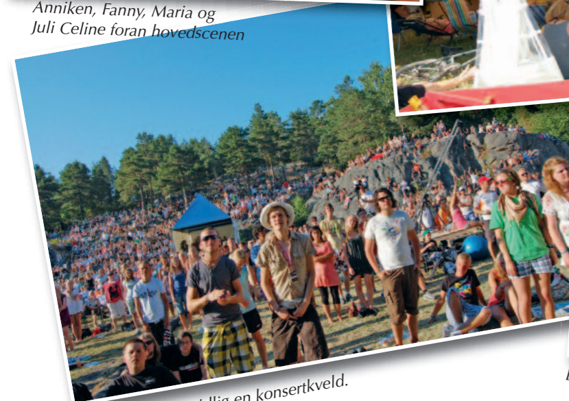
Fuglefjellet tidlig en konsertkveld.