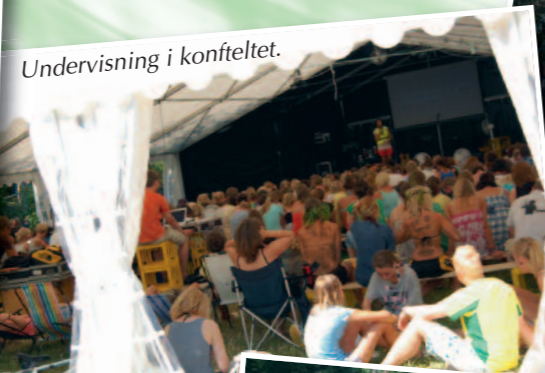
Undervisning i konfteltet.