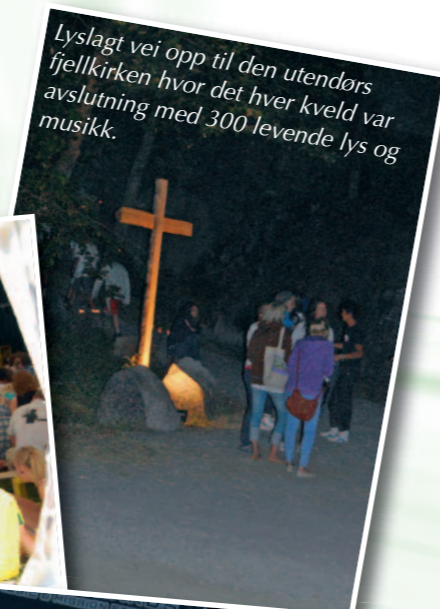
Lyslagt vei opp til den utendørs fjellkirken hvor det hver kveld var avslutning med 300 levende lys og musikk.