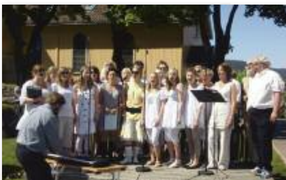
Drøbak Gospel i aksjon

I strålende sommervær var mange av kommunens lag og foreninger på plass på Torget og ga ut informasjon om alt de driver med. På kirkens stand var ballkonkurransen med garantert premie til alle et populært innslag. Drøbak Gospel holdt en flott minikonserter fra scenen. Med god trøkk i koret og sterke solister i front ga dette mersmak og vi gleder oss å høre koret igjen ved en senere anledning.