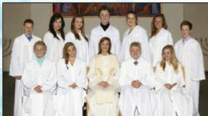
Konfirmanter i Frogn kirke 9. mai.