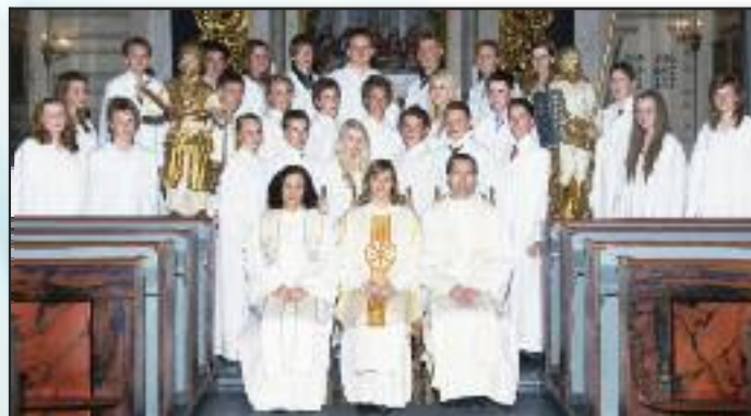
Konfirmanter i Drøbak kirke 8. mai.