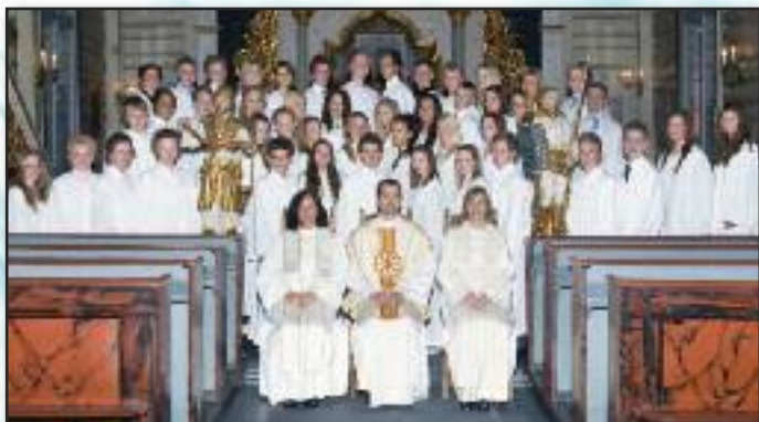
Konfirmanter i Drøbak kirke 2. mai.

Gratulerer med dagen som var; alle sammen!