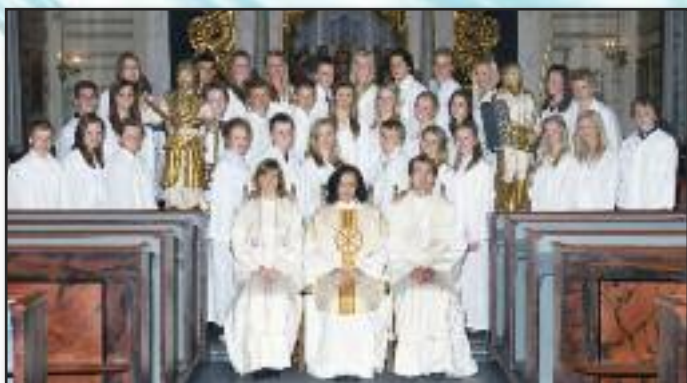
Konfirmanter i Drøbak kirke 9. mai.