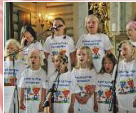
Barnegospel i sine nye t-skjorter for anledningen.