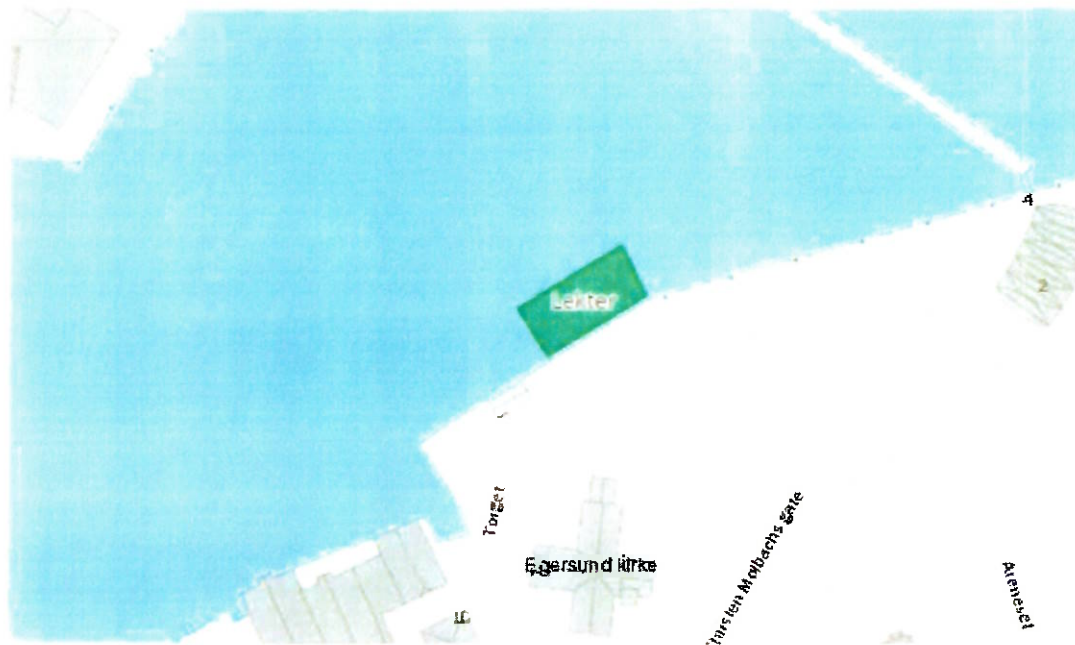
Omsøkt plass på kaien.