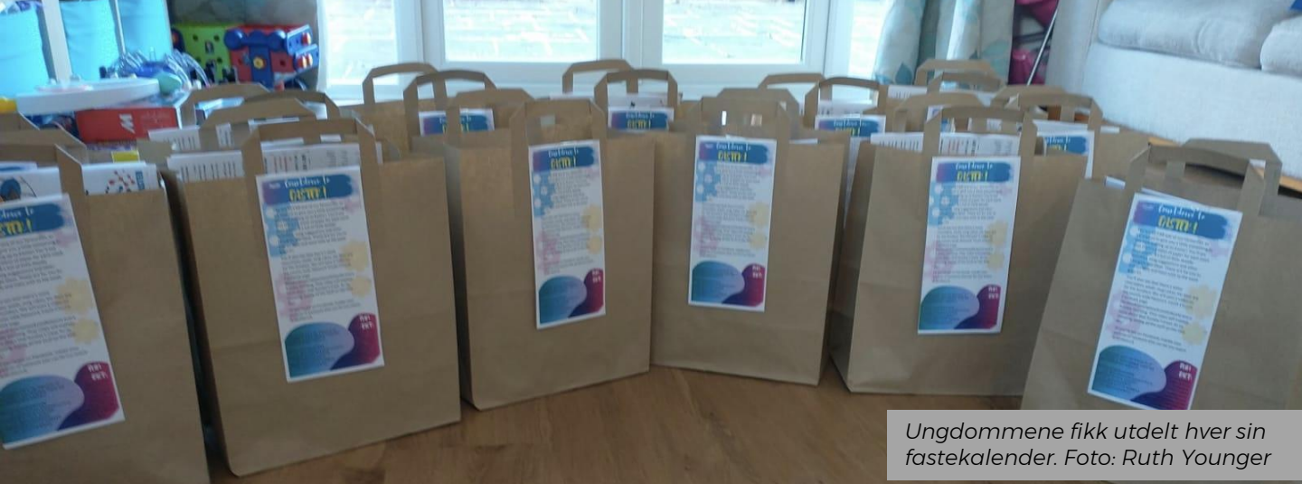
Ungdommene fikk utdelt hver sin fastekalender.