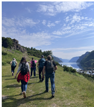
Stabstur for kirkekontoret til dagshytta Kaurebu i Bjerkreim