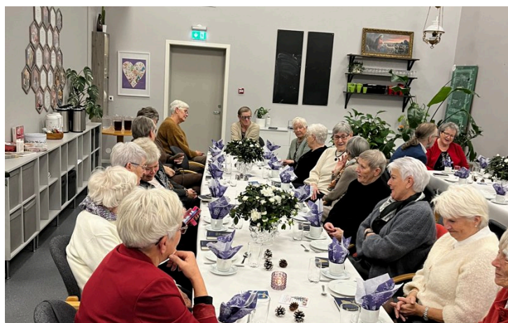
GODT LAG: Kvinneforeningen på Eigerøy er både driftig og sosialt. Siste mandag hver måned samles damer i fellesskap, der det både skapes gaver til den årlige basaren og et godt og trivelig miljø å være i.

Foreningen bidro også med mye penger til innredning av aktivitetshallen med møterom, gymsal og verksted. Soul Child-