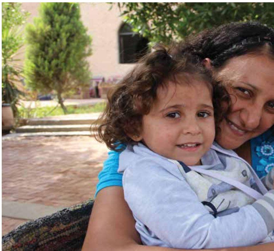
Merna, som har vært med som en av lederne for kursene helt siden starten, sammen med

vanskelig for oss som lever i en norsk kontekst, å forstå hvor utfordrende det er å være kvinne og kopter i Egypt. Fra jentene er helt små, blir mange av dem fortalt at de ikke har noen verdi. Først er det deres far og brødre som bestemmer over dem, for at de så skal bli gift og bli kontrollert av sin mann.