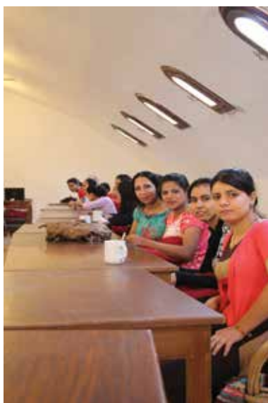
Her er noen av deltakerne på det siste Axia-kurset i oktober.