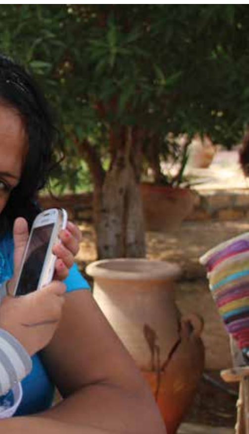
sin lille datter.

Det jobber vi iherdig for å endre på! sier Merna entusiastisk.