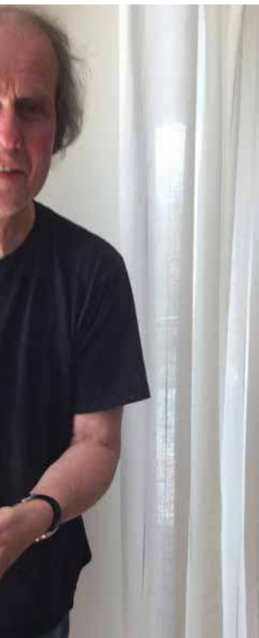
og bønnekort.

- Men for guttene i gata ble jeg et fremmedelement. Mine historier var fra en annen verden, som de fleste av dem kjente lite til. Det vakte kanskje misunnelse. I alle fall vakte det irritasjon.