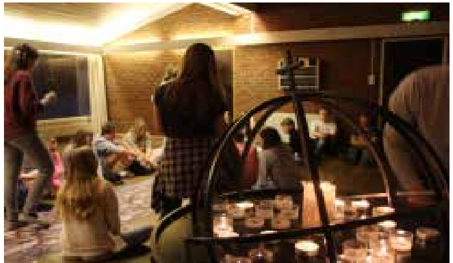
Bønnevandring med lystenning for venner, skrive takkebønner og være stille for Gud.