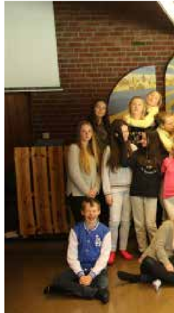
En knallfin og motivert konfirmantgjeng i Mari hadde

Det er fint å se at konfirmantene sitter sammen i stillhet, hvisker