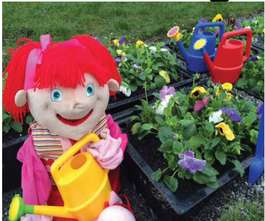
200 barn i Enebakk skaper blomster- og fargeglede ved kirkene og ved menighetshuset på Flateby.