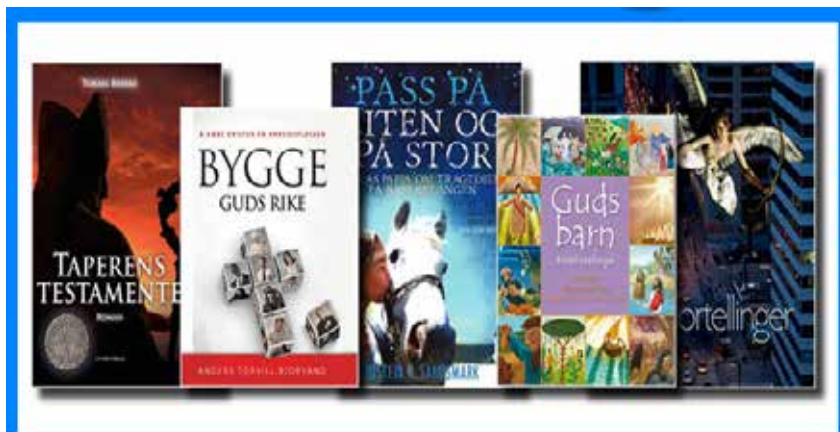
Et lite knippe av hva KABBs lydbibliotek kan tilby.

Det er også mulig å kjøpe en Daisy-spiller direkte fra en forhandler.