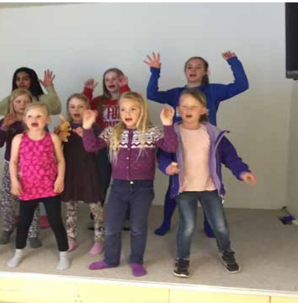
i aksjon.