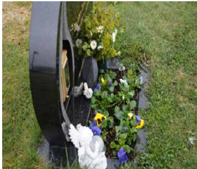
Vakker beplantning ved et gravminne.

Det er mulig å gjøre avtale om stell av graven med kirkekontoret. Det kan betales for årlig stell av graven: Vanning, stell og vanning, eller full pakke med beplantning stell og vanning. Det kan også opprettes et gravlegat, hvor det avsettes en sum til stell av graven i maksimalt 20 år. Kirkevergen er kontakt-