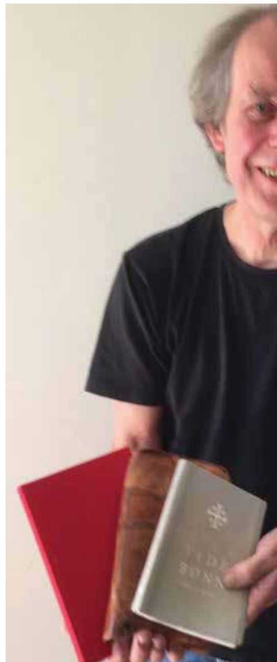
Kjell med "matpakke", bibel, tidebønner, notatbok

- Jeg lærte meg snart kodene. Det var ett språk som gjaldt på Bygdøy og ett ute i gata på Løkka. Så jeg la an språket etter hvor jeg befant meg, ble rent ut sagt en kameleon, smiler Kjell.