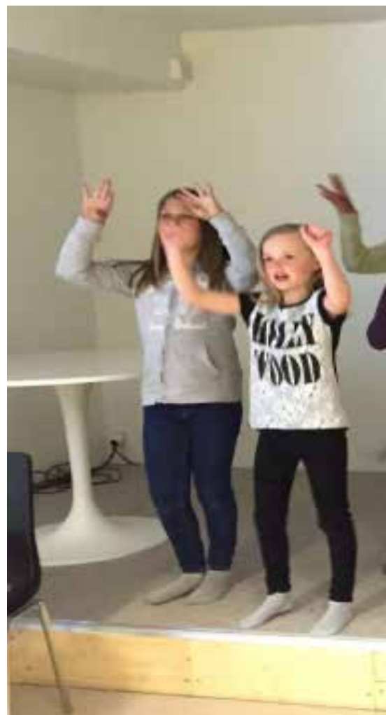
Sprudlende sangglede når Enebakk Soul Children er

større kor som sprudlet på ulike tilstelninger i bygda. På ett tidspunkt var Enebakk Soul Children oppe i 50 medlemmer. Grupper innen koret har også tidligere stilt opp i Ungdommens kulturmønstring, og sågar gått videre til fylkesmønstringen. Så for halvannet år siden dalte medlemstallet.