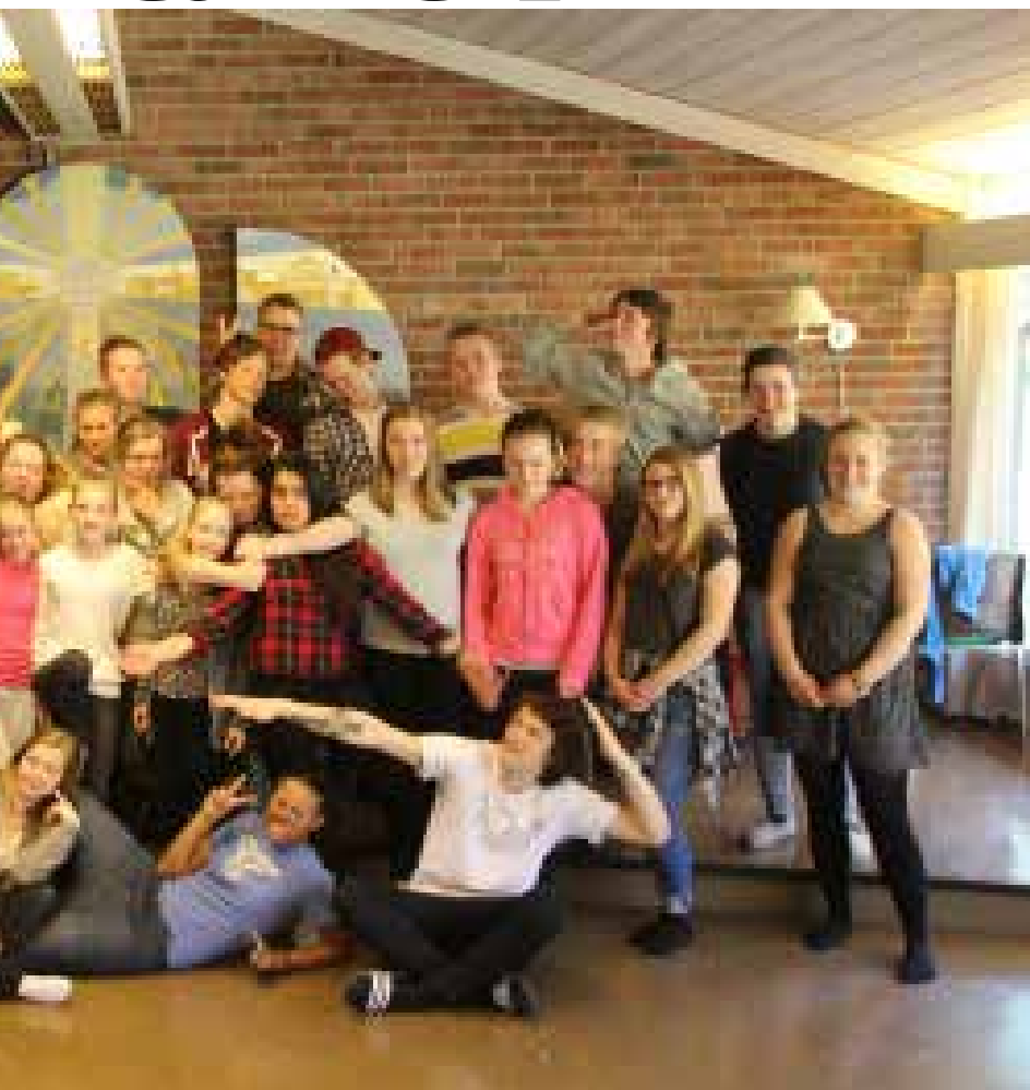
le en fin avslutningsleir på Sjøglimt ved Ørje i april.

med en fin fellessamling hvor hver smågruppe presenterte bibeltekster fra gruppesamlingene på en kreativ måte via film, dans eller drama.