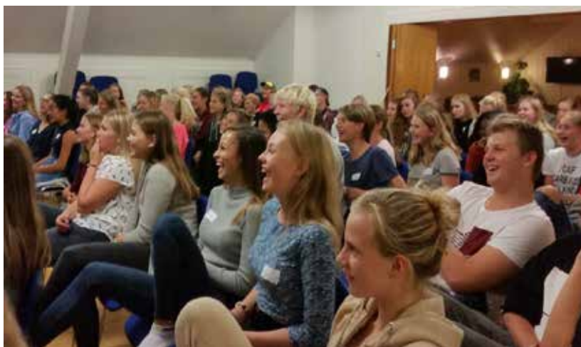
Konfirmantene tar med seg mange gode minner fra leiren på Mesnali.