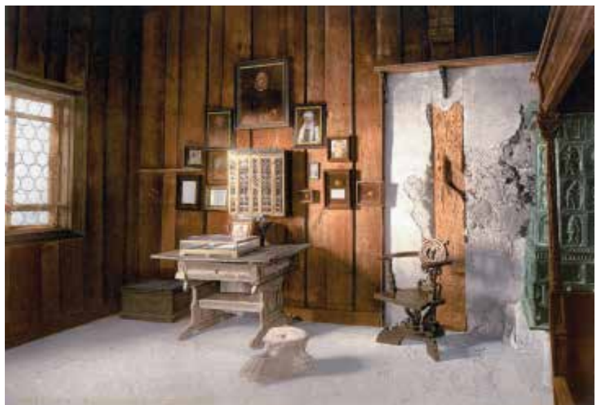
Dette var arbeidsrommet til Martin Luther på slottet i Wartburg under hans arbeid med oversettelsen av Det nye testamente til tysk.

Første opplag ble raskt utsolgt, og det kom en lang rekke nye