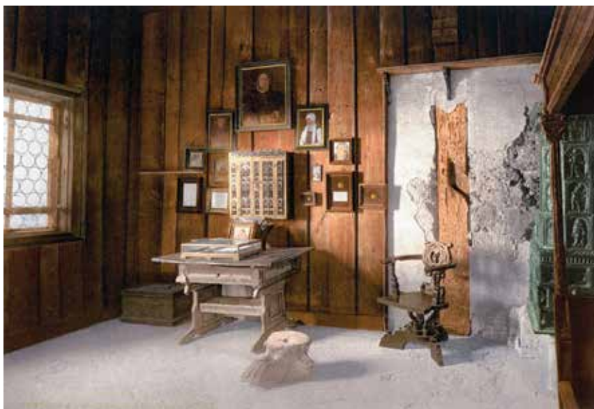
Dette var arbeidsrommet til Martin Luther på slottet i Wartburg under hans arbeid med oversettelsen av Det nye testamente til tysk.

Første opplag ble raskt utsolgt, og det kom en lang rekke nye