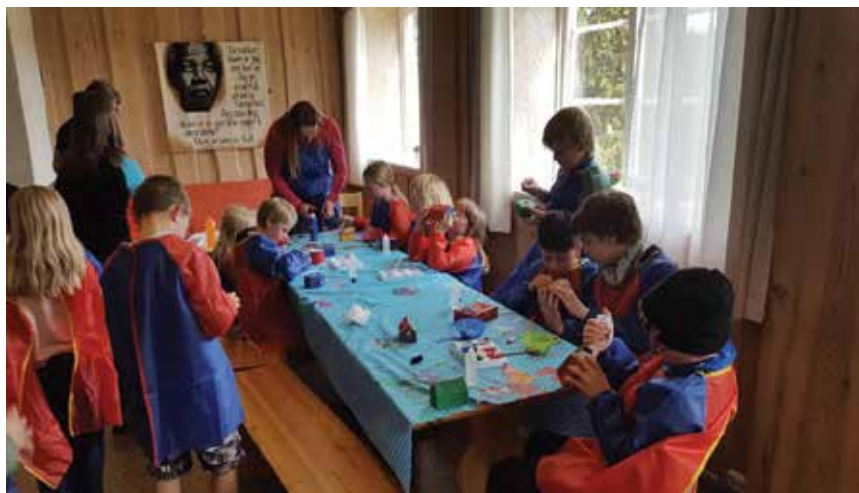
Masse hobbyaktiviteter under Sareptas krukkes Slora-leir i høst.

Det er felles samling med andakt og ulike gruppeaktiviteter som kor, forming, og speider. Gruppeaktivitetene avsluttes med et enkelt felles måltid, slik at barna går mette hjem. Det kan være opp til førte barn på en vanlig torsdag og vi har med oss en flott gjeng med voksenledere.