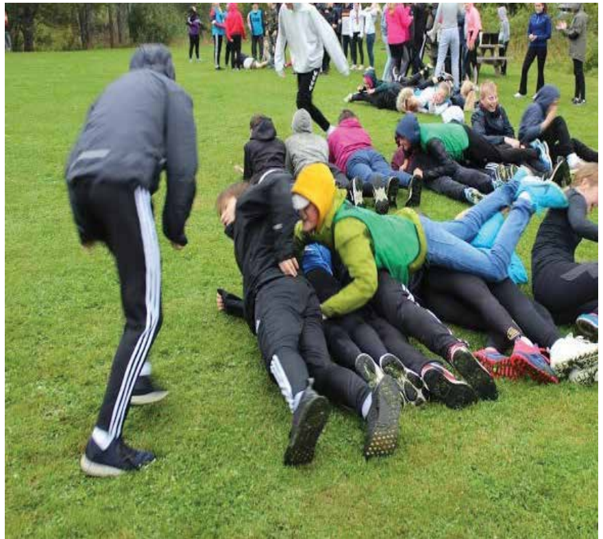
Uteaktivitetene er populære innslag på konfirmantleirene.

Nok en gang fikk vi oppleve at konfirmantleiren er med på