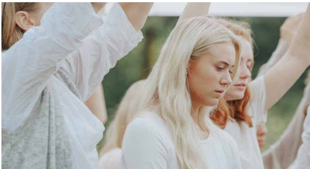
”Disco” gjør ikke narr av Mirjams tro.