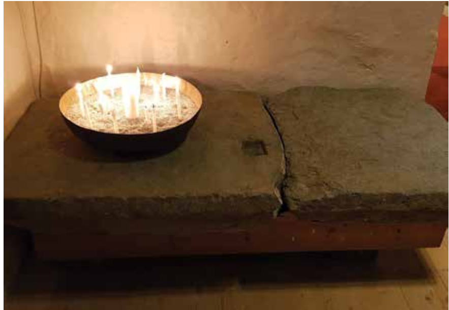
Det gamle alteret med ny plassering og ny funksjon i Enebakk kirke. Nå brukes det til lystenning.

Etter at graven ble slettet, ble steinen tatt i bruk som dørhelle