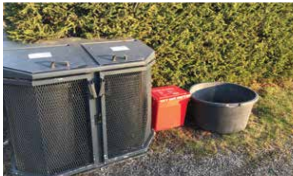
Egne beholdere for ulike typer avfall er plassert på kirkegårdene.

I forbindelse med omorganisering til ett sokn, vil budsjettet for menighetsråd og fellesråd bli slått sammen fra 2020. Det vil ikke bli endringer i menighetsrådets økonomi, men fellesrådet har fått en reduksjon i rammebevilgningen fra kommunen. Dette kuttet vil gjelde for alle avdelinger i kommunen, inkludert kirken. Det forutsettes at sammenslåingen av soknene vil gi en innsparing på 80 000 kroner. Resterende innsparing tas fra frivillig stillingsreduksjon, reduksjon i bruk av sommervikarer samt reduksjon i innkjøp. Det siste punktet vil også vurderes opp mot klima- og miljøtiltak, med økt fokus på gjenbruk.