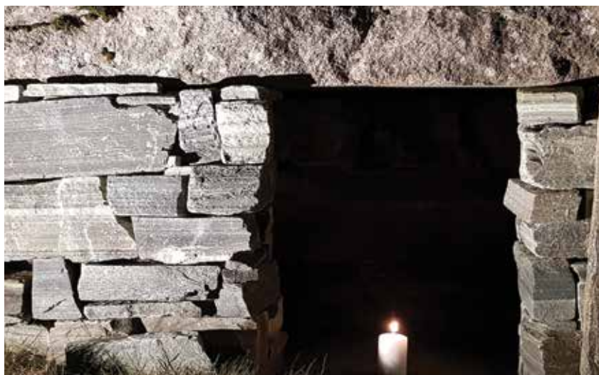
Den tomme grav.

fysiske ting i hendene, så hvorfor gjør vi det psykisk? Ikke misforstå meg her. Jeg sier ikke at vi ikke skal sørge. For å sørge er en prosess vi må gjennom for å finne tilbake til livet. Men hva skjer etter sørgeprosessen er over, det er der jeg tror Jesus kan komme med en oppstandelse, hvis vi tillater han. For hvis vi tillater Gud å komme inn i det skjulte rommet i våre hjerter, kan jeg ikke la være å tro at han vil gi det håp. At han vil komme med kjærligheten, gleder og ikke minst liv.