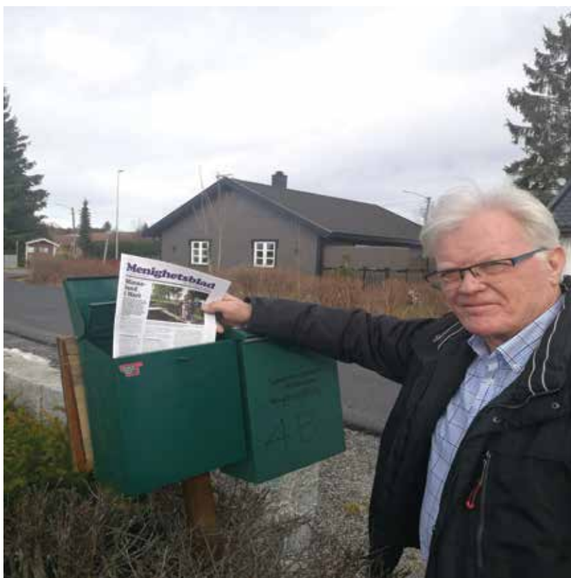
Enebakk menighet trenger hjelp fra frivillige til å være med på å distribuere menighetsbladet.

Vi trenger en dugnadsgjeng på rundt 20 personer som kan dele ut til i alt 4 000 postkasser. For hver tur hver person går, utgjør det et bidrag til menigheten på 725 kroner! Alt arbeid med Menighetsbladet utføres på dugnad, med unntak av trykking og porto. Portoutgiftene ble i fjor på hele 58 000 kroner og medførte et regnskapsmessig underskudd på 25 000 kroner. Ettersom alle inntekter til bladet kommer gjennom giver-