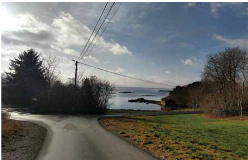
Eit glimt frå Stord.

Kårevik og Horneland. Stadnamn som er røtene mine. Som er meg. Det er ei stor velsigning å ha kontakt med røtene. Og det er ein nøkkel som får meg til å skjønne betre kven eg er i denne verda.