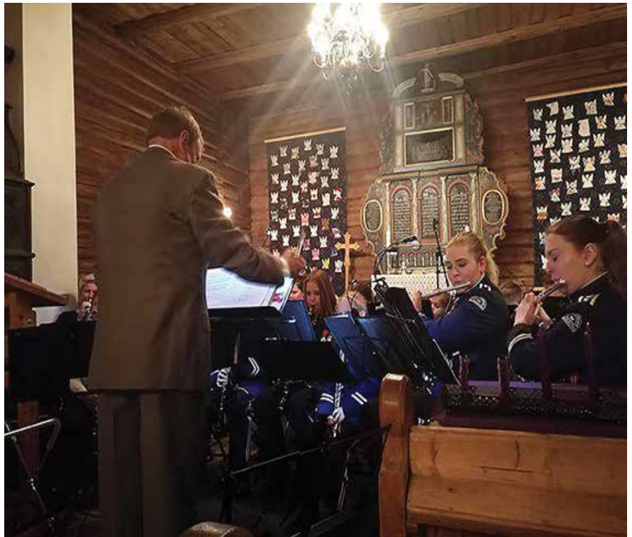
Adventskonserten i Mari kirke er et av årets høydepunkter for Ytre Enebakk Skolemusikkorps.