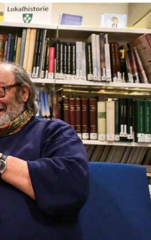
, også historier fra Enebakk kirke opp