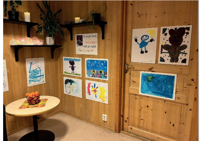
Barna i Mariklubben sto for disse flotte og fargerike kunstverkene.