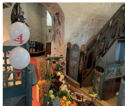
Høstens grøde og 4-åringene sto i sentrum for gudstjenesten denne søndagen.