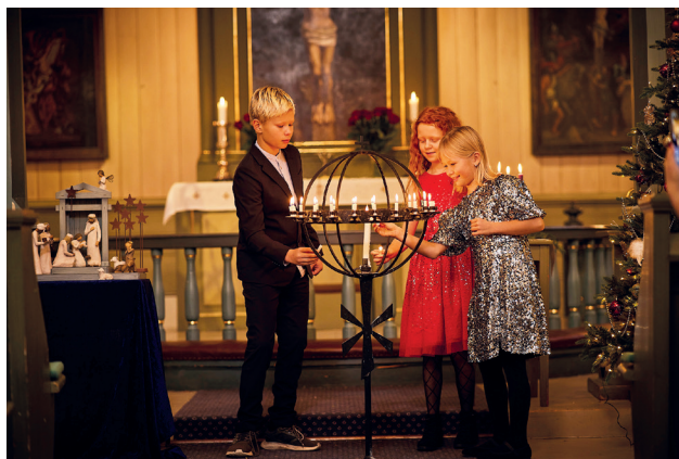
Så tenner vi et lys i kveld, vi tenner det for glede.. og for den store stjerna over stallen i Betlehem

-Hvorfor det? spurte gutten. Pappaen sa at han tror de ble så glade fordi det barnet var Guds kjærlighet som ble født på nytt inn i verden. Og den verdenen