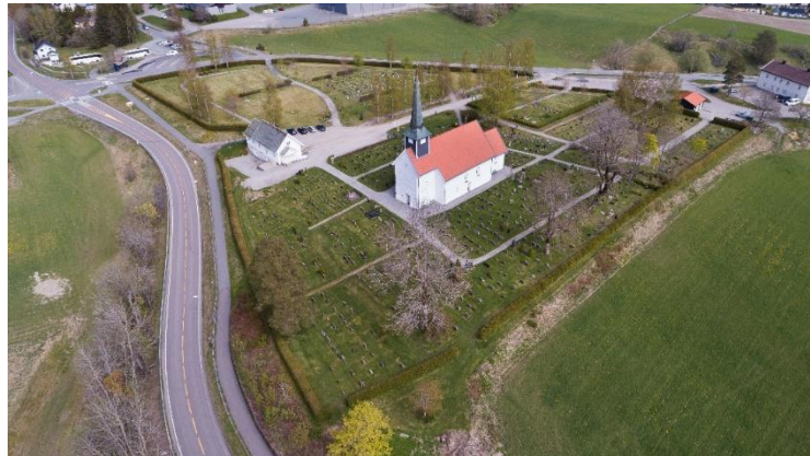
Dronebilde av Enebakk kirke med kirkegård og hekk.

Enebakk sokn vant i 2020 en gjev førstepris fra Gravplassforeningen for granhekken rundt Enebakk kirkegård i konkurransen «Gravplassens inngjerding og porter».