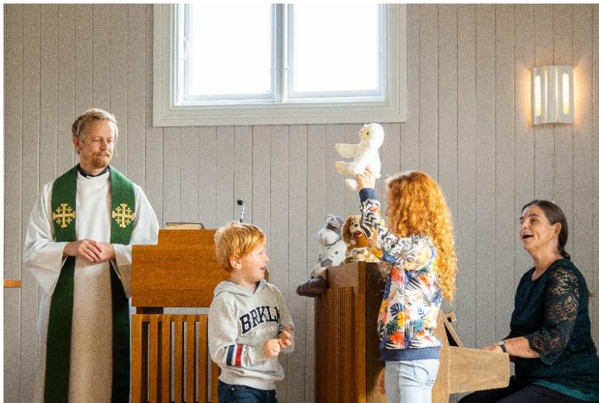
Fra søndagsskolegudstjeneste på Flateby