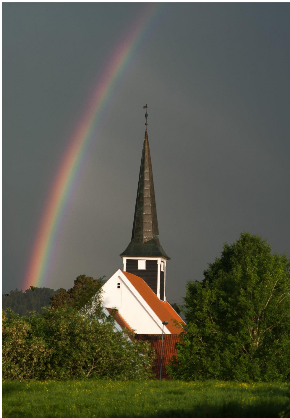
Enebakk kirke med regnbue.