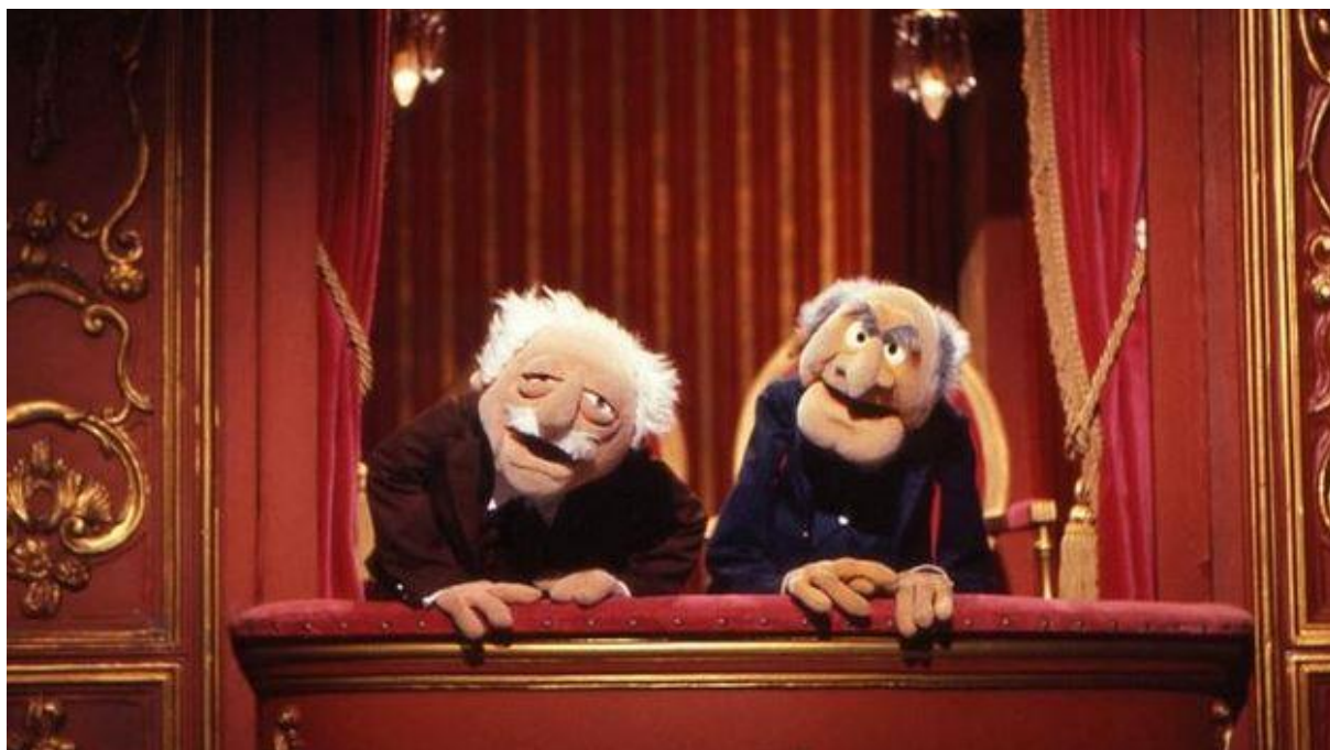
Gubbegruppa – bare for menn!