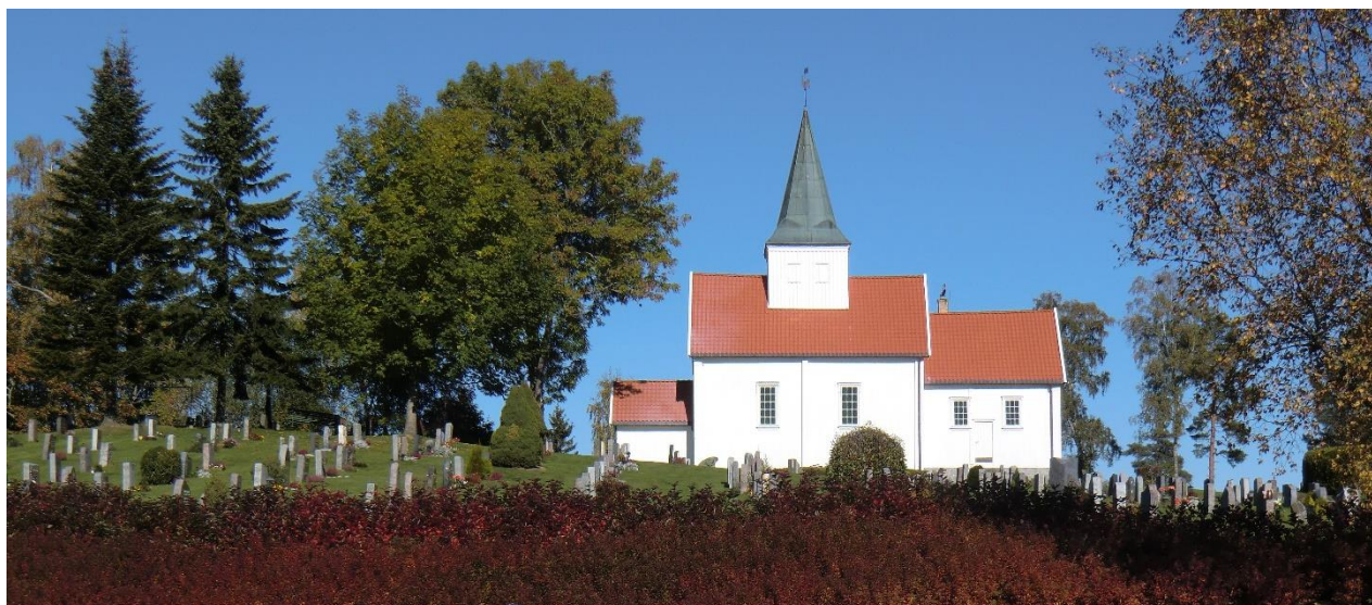
Mari kirke