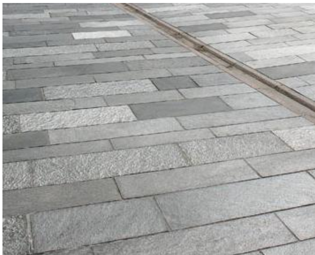
Bilete 7: Skiferdekket på plassane er tenkt i store, rektangulære heller med fallande lengder og ulike breidder, lagt i forbandt mønster (døme til venstre er Oppdalskifer).