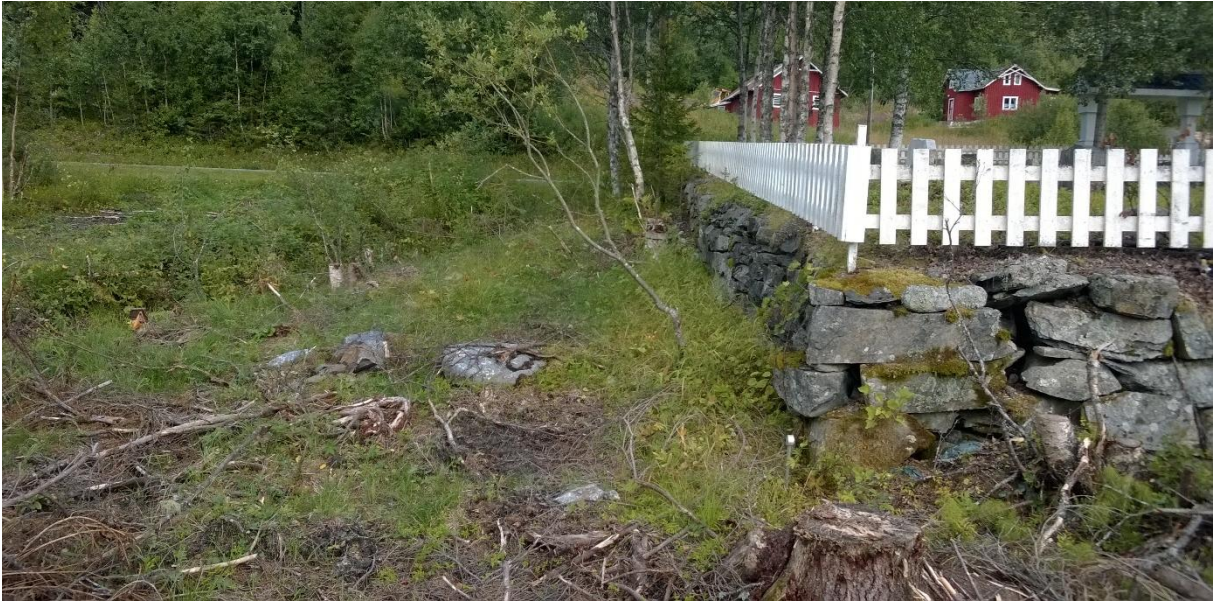
Bilete 8: Kyrkjegardsmur med lokal morenestein, eventuelt innkjøpt liknande stein (t.d. Hardangerskifer) og stakittgjerde oppå mur, er tenkt vidareført inn i ny del.