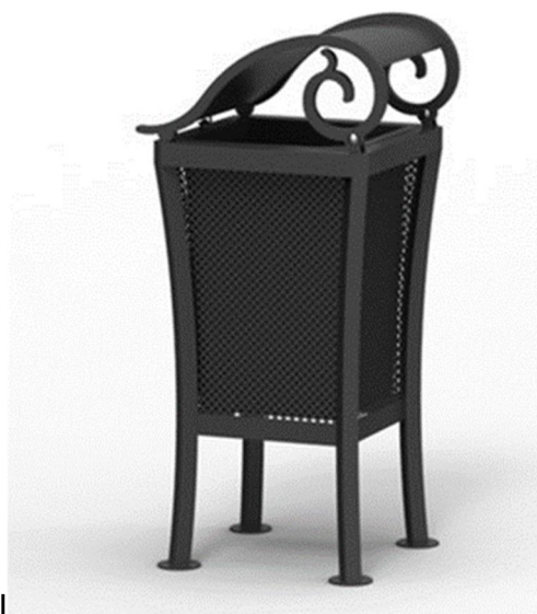
Bilete 12: Døme på avfallsdunk med klassiske stiltrekk; Lilly avfallsdunk frå TRESS.

https://www.tress.com/nb-no/lekeplass-og-parkutstyr/opphold-og-utemiljoe/lilly-avfallsdunk-med-tak-714406/