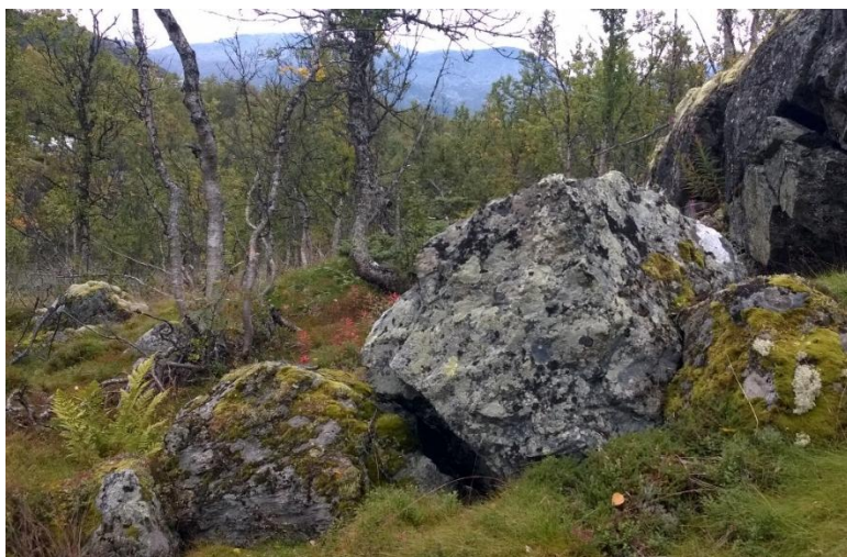
Bilete 1: Døme på type naturstein som er ynskjeleg inntil natursteinsmuren i minnelunden.

Planlagt namna minnelund blir sentral i anlegget inntil og som ein del av, den vesle, runde plassen som avsluttar den grusa prosesjonsvegen, midt i anlegget. Felles gravminne for minnelunden er tenkt som ein natursteinsmur som går ut ifrå/ stør seg inntil ein stor kampestein/ naturstein i den eine enden. Minneplater skal festast på muren, på sida mot minnelunden (sjå detaljplan for minnelunden, samt illustrasjonsfoto under).