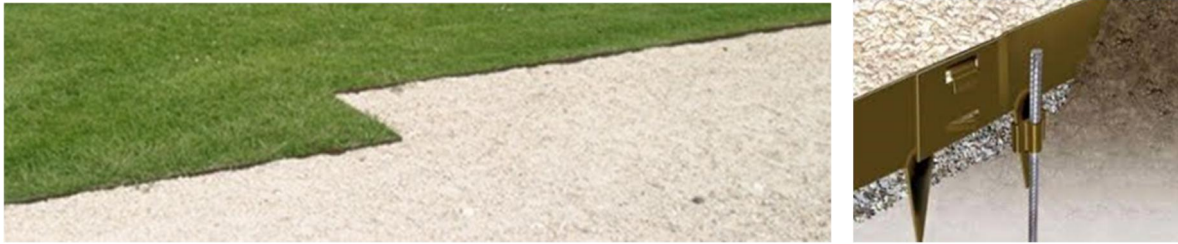
Bilete 4 og 5 - døme på type stålkant: Ever Edge stålkant mellom heller og grus eller gras.

Som ledelinje og oppsamlingsrenne for overvatn er det lagt inn tre rekkjer med storgatestein i granitt med ein svank på 2cm i midten. Dette vil også gje estetisk kvalitet i miljøet, og og heve standarden på anlegget. Saman med ny trappe- og rampeløysing for universell tilkomst til kyrkjebygget vil dette bli eit element som skapar samanheng og lesbarheit i anlegget for alle.