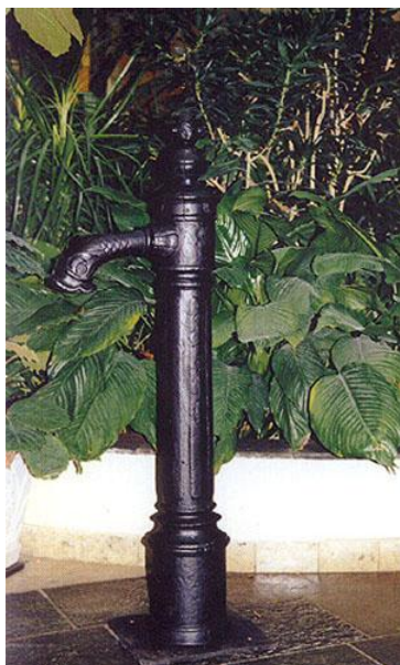
Bilete 11: Planlagt vasspostkran (Malmkranen) i støpjern frå Benzen har eit klassisk uttrykk og vil passe godt inn i anlegget dersom den blir lakkert svart. www.benzenas.no

På eksisterande kyrkjegard er dette med vasspost ikkje handtert på ein god måte, kun ein slange med kran i enden er lagt ut til eit av trea, og bunde opp der. Dersom vassposten skal kunne vere eit positivt og «berikande» element i miljøet bør den få noko meir omtanke og kvalitet enn i dagens anlegg. Det skal leggjast ut to nye vasspostar i anlegget for å dekke arealet med 35m radius i forhold til bæring av vatn. Sommarvatnet treng eit pumpehus for å få nok trykk. Sjå plassering på plan. Herifrå går det vassleidningar til dei to vasspostane. Det må monterast tømmekran i kummen under vasspostane, slik at anlegget lett kan tømmast for vatn før vintersesongen. Pullerten må ha svart lakkert overflate for å harmonere med smijarnsportar, og nye søppeldunkar.