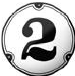
Bilete 11: Dømet t. v. er henta frå nettsida til Gamle trehus: https://www.gamletrehus.no/index.php?page=58

Når det gjeld skilting av dei ulike gravfelte er dette tenkt utført i kvit emaljert metall med svartmåla inngraverte bokstavar på kvitmåla treverk. Skilta må stå godt synleg ved gangvegen. Kvite, emaljerte metallskilt vil høve godt i det miljøet her, til dømes noko slikt i høveleg format og med riktig bokstav: