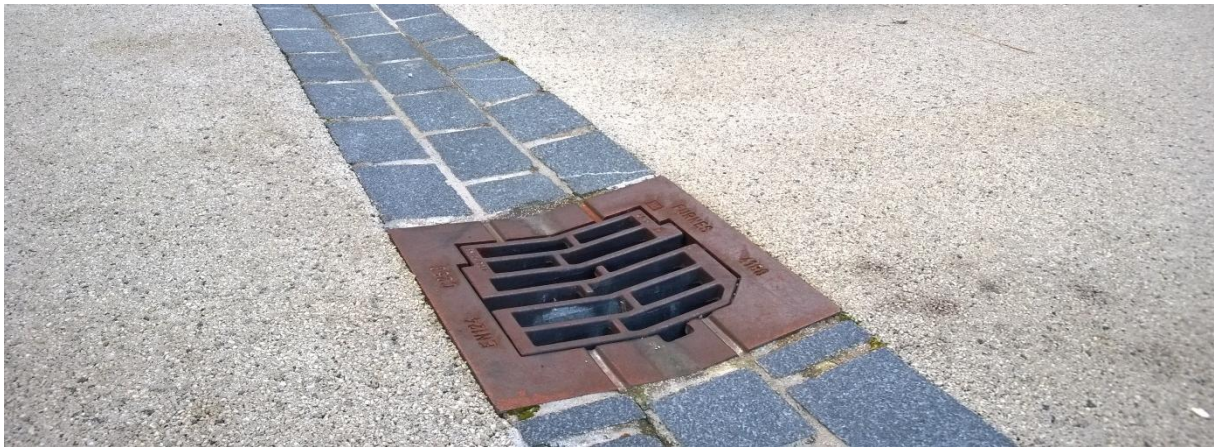
Bilete 6: Døme på kombinert ledelinje og vassrenne med 3x storgatestein (på bildet med «saget» overflate) og tilpassa gatesluk. (Frå Høgskulen i Bergen, foto: ML)

Som ledelinje og oppsamlingsrenne for overvatn er det lagt inn tre rekkjer med storgatestein i granitt med ein svank på 2cm i midten. Dette vil også gje estetisk kvalitet i miljøet, og og heve standarden på anlegget. Saman med ny trappe- og rampeløysing for universell tilkomst til kyrkjebygget vil dette bli eit element som skapar samanheng og lesbarheit i anlegget for alle.