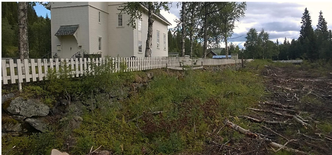
Bilete 3: Utvidelsesområdet etter hogst, tilsvarende mur blir sett opp nokon meter lengre ut mot elva.