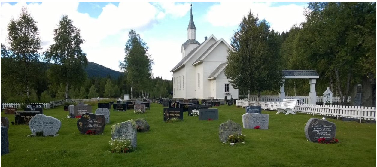
Bilete 9: Eksisterande kyrkjegard har kvite, klassiske parkbenkar som med fordel, kan vidareførast inn i det nye anlegget.

Dei kvite benkane som er på kyrkjegarden i dag, høver godt inn, og bør vidareførast inn i den nye delen. Sjø bilete under. Ein av benkane vil få universell tilkomst og utforming (ved minnelunden). Denne benken må då ha armlene på minst ei side.