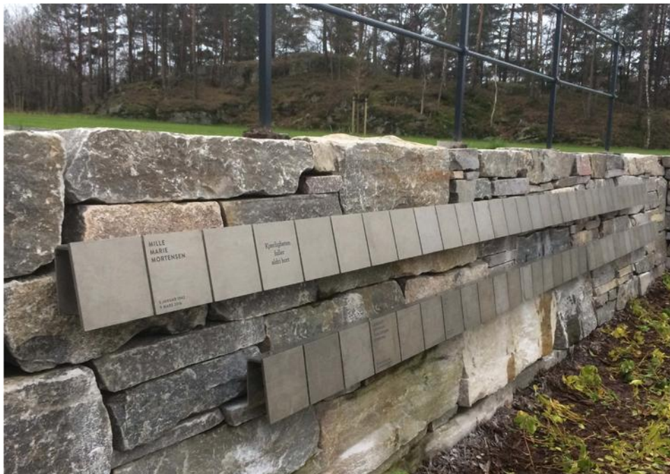
Bilete 2: Døme på minneplater og mur på Voie gravlund.

Muren er tenkt nøyaktig bygd med god murestein. Metallplater, som i dømet på biletet under, skal festast på muren. Dømet under er henta frå minnelunden på Voie.