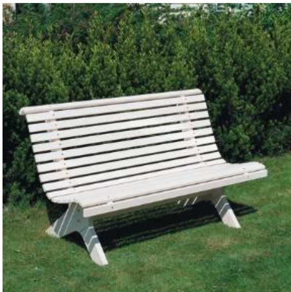
Bilete 10: Desse finst i handelen framleis.

Når det gjeld skilting av dei ulike gravfelte er dette tenkt utført i kvit emaljert metall med svartmåla inngraverte bokstavar på kvitmåla treverk. Skilta må stå godt synleg ved gangvegen. Kvite, emaljerte metallskilt vil høve godt i det miljøet her, til dømes noko slikt i høveleg format og med riktig bokstav: