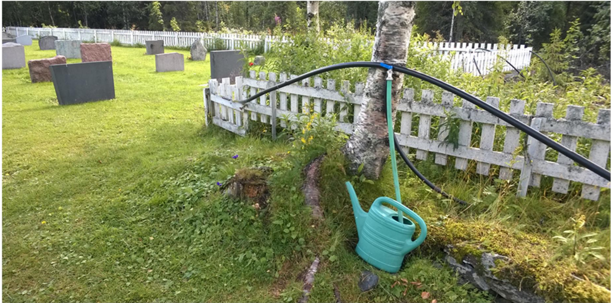
Bilete 12: Eksisterande vasspost ligg omtrent der den nye plassen ved minnelunden kjem. Det er planlagt ny vasspost inne på plassen, denne vil bli lettare å bruke, for alle.