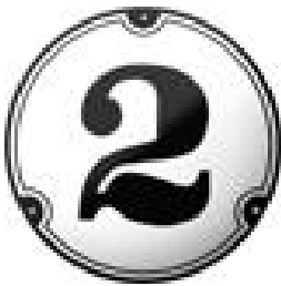
Bilete 11: Dømet t. v. er henta frå nettsida til Gamle trehus: https://www.gamletrehus.no/index.php?page=58

Når det gjeld skilting av dei ulike gravfelta er dette tenkt utført i kvit emaljert metall med svartmåla inngraverte bokstavar på kvitmåla treverk. Skilta må stå godt synleg ved gangvegen. Kvite, emaljerte metallskilt vil høve godt i det miljøet her, til dømes noko slikt i høveleg format og med riktig bokstav: