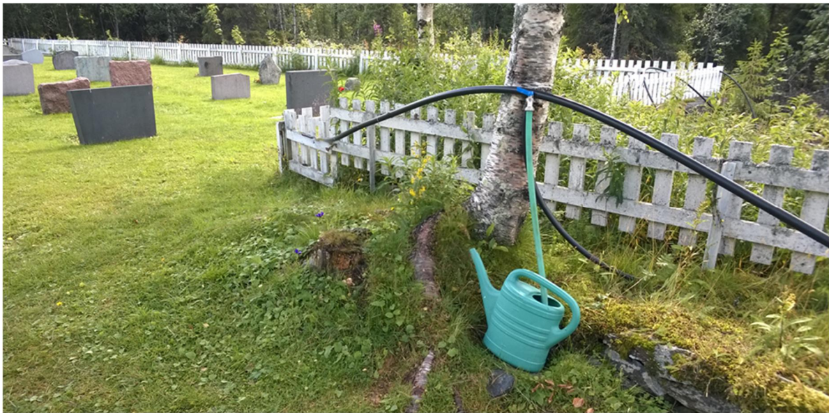
Bilete 12: Eksisterande vasspost ligg omtrent der den nye plassen ved minnelunden kjem. Det er planlagt ny vasspost inne på plassen, denne vil bli lettare å bruke, for alle.