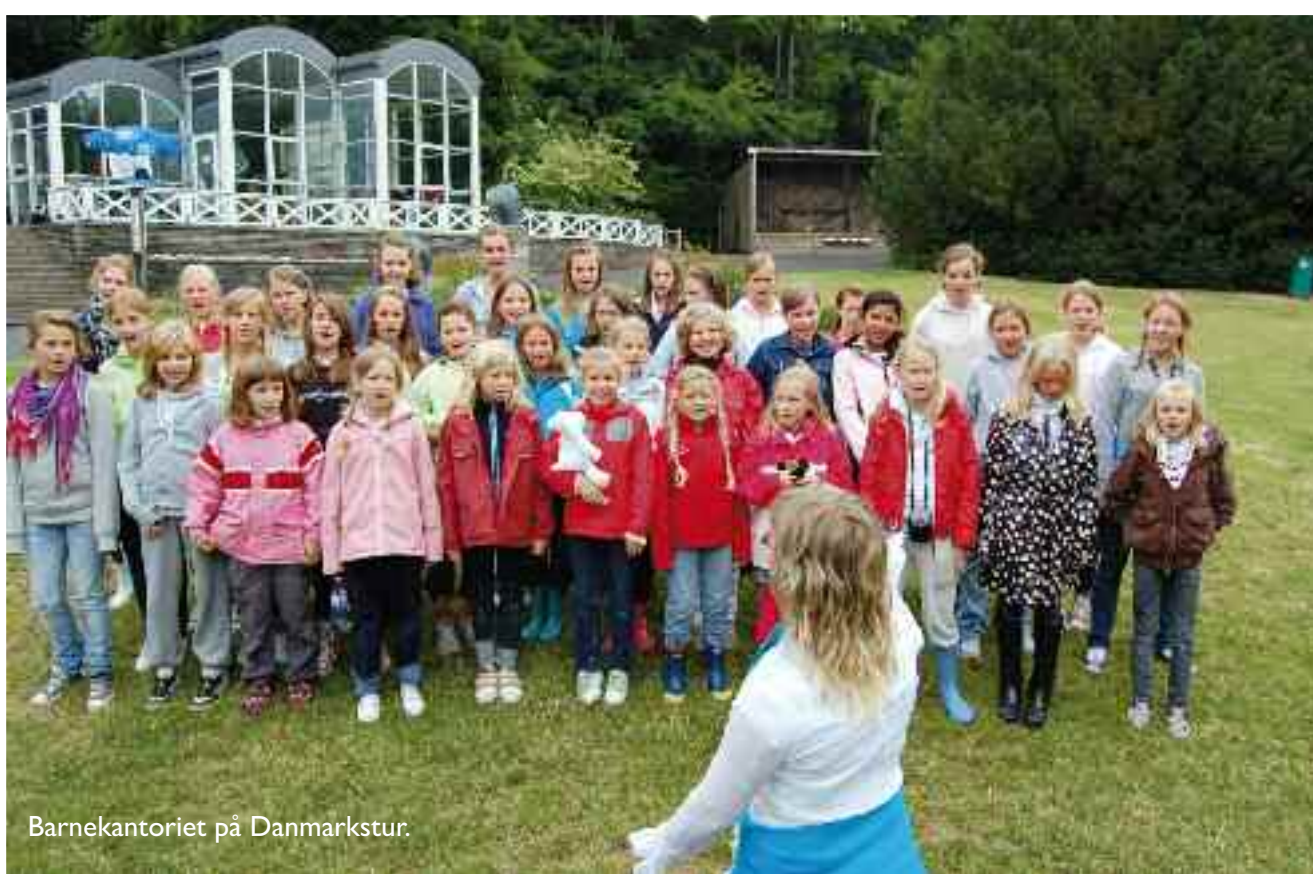
Barnekantoret på Danmarkstur.