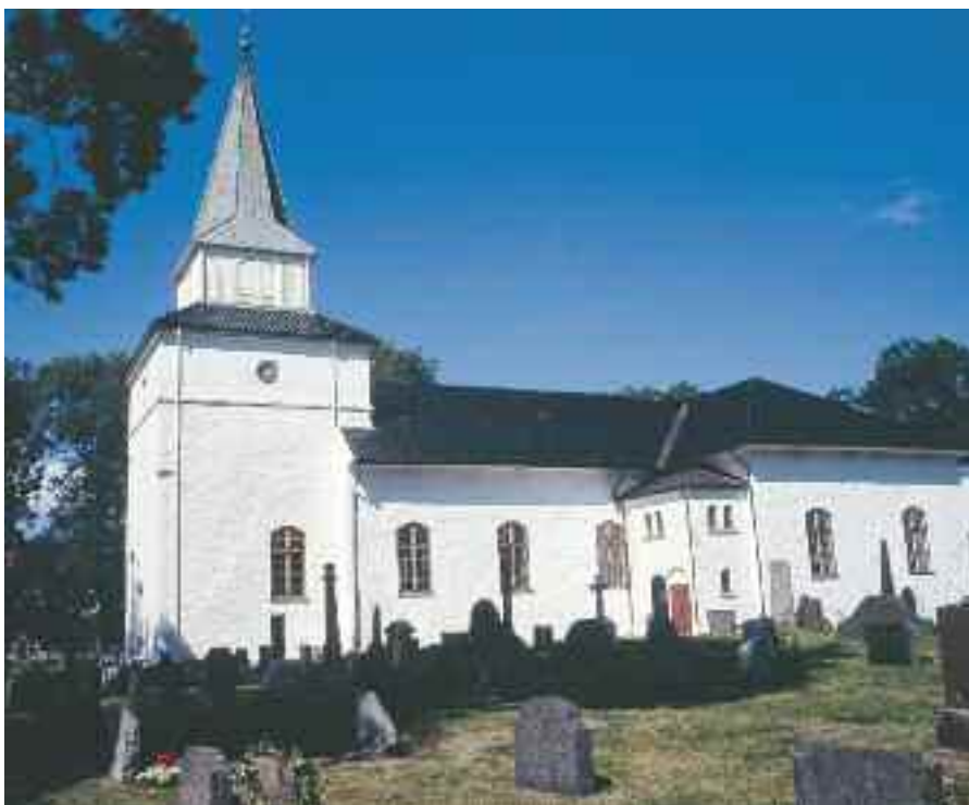
Nøtterøy kirke er blant landets forsøks-sokn for den nye liturgien som nå forligger som forslag og er ute på høring.

Den skal innføres i alle landets kirker første søndag i advent 2010. Samme dato skal det innføres ny salmebok for Den norske kirke – på Nøtterøy skal vi i tillegg prøve ut denne i forsøksperioden. Og forsøksperioden er 1.september 2008 til 31.januar 2009. Men enhver