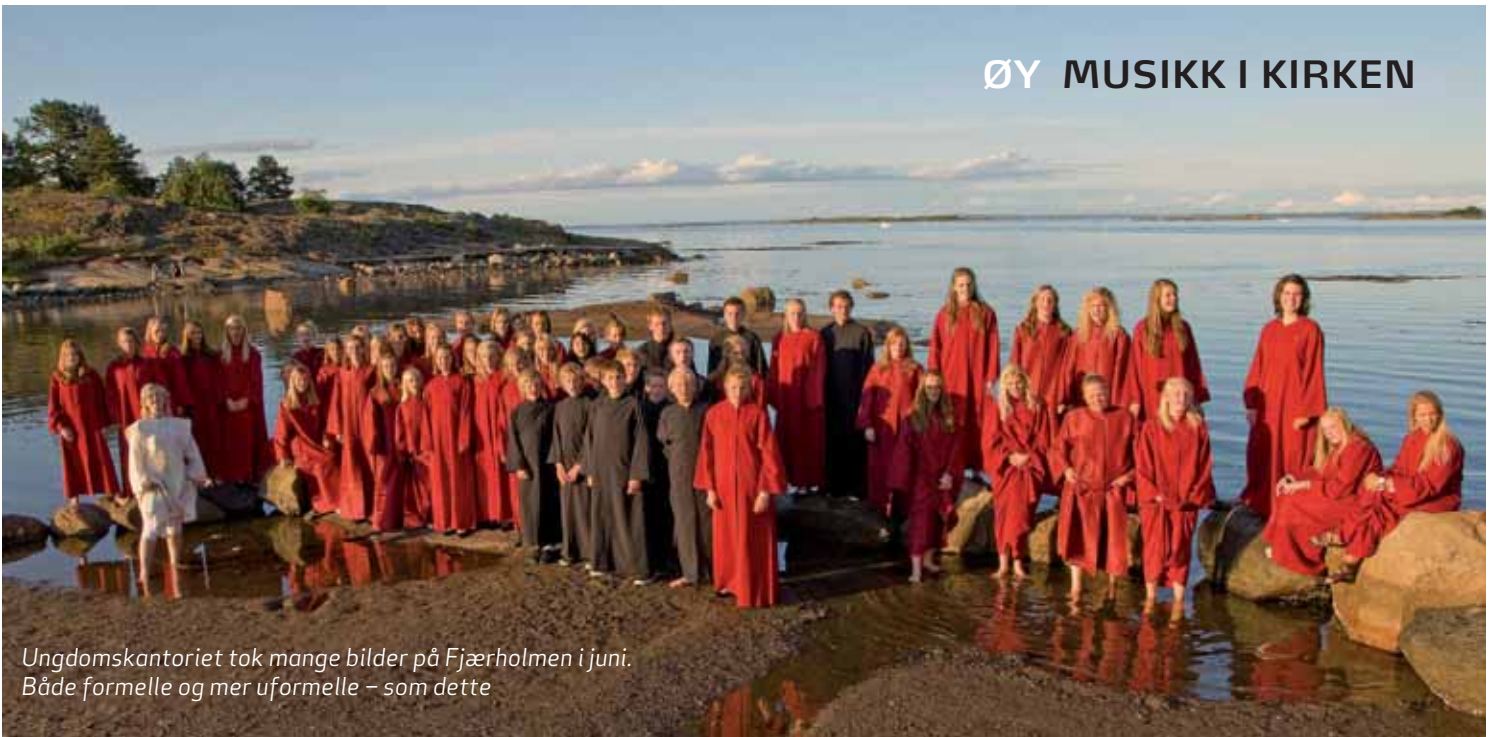
Ungdomskantoriet tok mange bilder på Fjærholmen i juni. Både formelle og mer uformelle – som dette