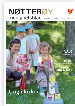
FORSIDEBILDE: Søndagsskolen

Torød kirke og kirkestue 33 38 43 30 Telefax 33 38 66 88 Kirketjener/vaktm. Ingrid Almquist 33 38 43 30