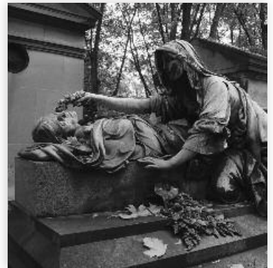
En reise i kunstens verden