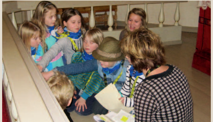
En gruppe barn løser mysterier på jakt etter kirkeskatter

Agentene med familie deltok søndag på familiemesse i Nøtterøy kirke.