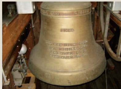
En av klokkene med påskriften “Fred - klokke ring fred fra himmelborg. Fred over livet - Fred over sorg.”