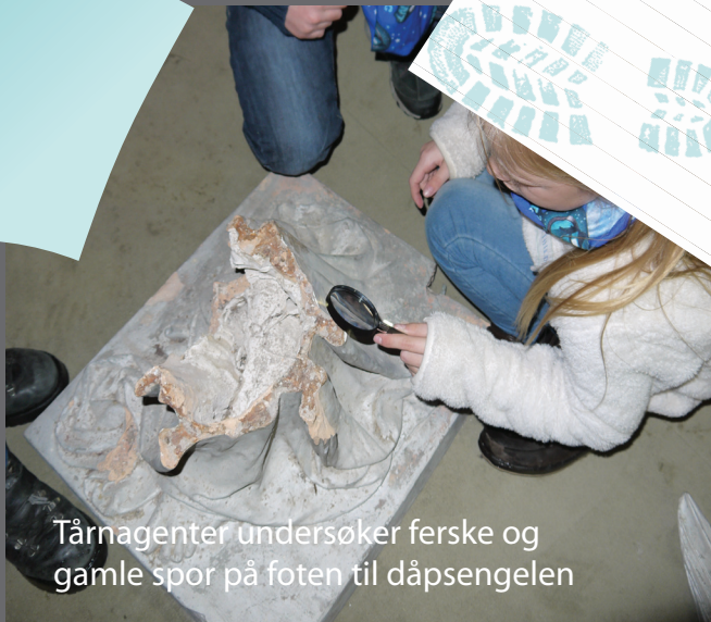
Tårnagenter undersøker ferske og gamle spor på foten til dåpsengelen