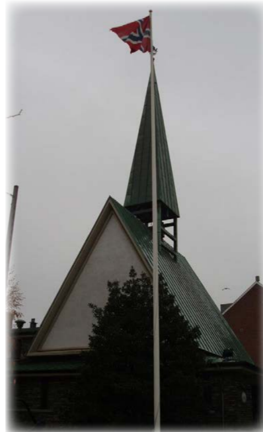
Sjømannskyrkja i København

Sjømannskyrkja har mange forskjellige tilbod til nordmenn i utlandet f.eks. gudstenester, sosiale- og kulturelle møtepunkt, skipsbesøk, kriseberedskap etc. Eg har sjølv besøkt 9 av sjømannskyrkjene – har mange gode opplevingar i møte med kjerka. Anten du er turist, student eller fastbuande vil eg anbefale eit besøk på sjømannskyrkja. Du får god kaffi og velsmakande vaflar og treffer på hyggelege og hjelpsame menneske. Sjømannskyrkja har ei god og informativ heimeside: www.sjomannskirken.no