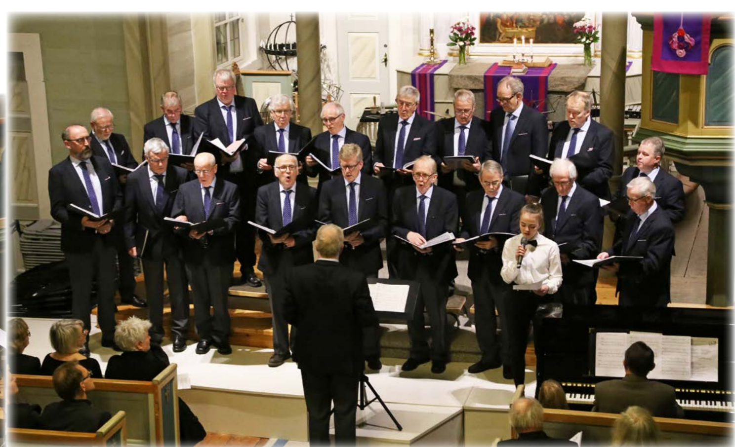
↑ Osternes Mannskor