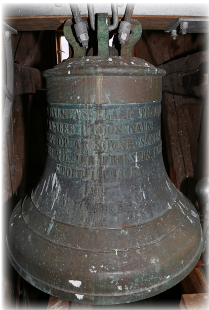
"Nye klokka" - frå 1854

Denne bronseklokka med høgd 37 cm og diameter 40 cm har slik latinsk inskripsjon; "Sum prece Christi populi succurre te clamo. Absalon