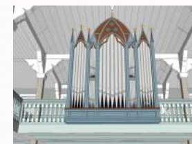
fasaden - opphavleg frå 1895

Galleriet vert bygd opp på ny. Det vil få korte sidegalleri som har plass til mellom anna kor. Brystninga får søyler i rekkverk, som vil opna det tidlegare litt tronge og mørke galleriet.