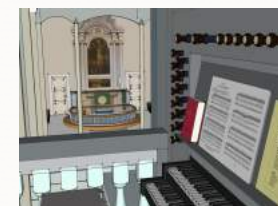
orgelet får 24 stemmer

Med 24 stemmer får orgelet ein rik klangpalett. Det vil med sine fylldige grunnstemmer kunna bera salmesongen på ein heil ny måte. Kvar pipe i orgelet blir nøyte tilpassa kyrkjerommet. Musikk frå ulike epokar og opphav skal kunna koma til sin rett og inspirera både musikarar og kyrkjelyd.