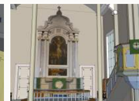
til inspirasjon for både musikarar og kyrkjelyd