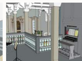
kyrkja får korte sidegalleri