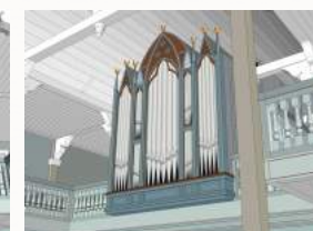
kyrkja får nytt galleri