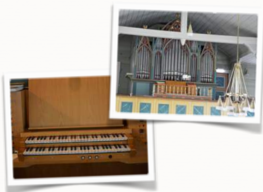
Fasaden frå det første orgelet av orgelbygger Kvarme. Spelepult frå 1969 av orgelbygger Jørgensen.