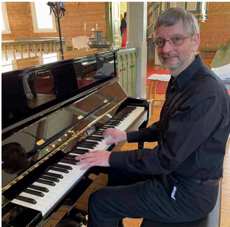
For eit par år sidan fekk Dale kyrkje nytt, flott og kostbart konsertpiano.