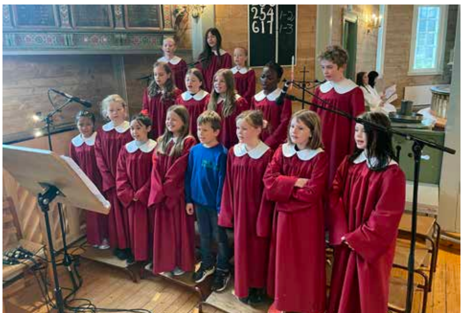
Dale barnekor deltek i gudstenester med korsong og ved å synge til delar av liturgien.