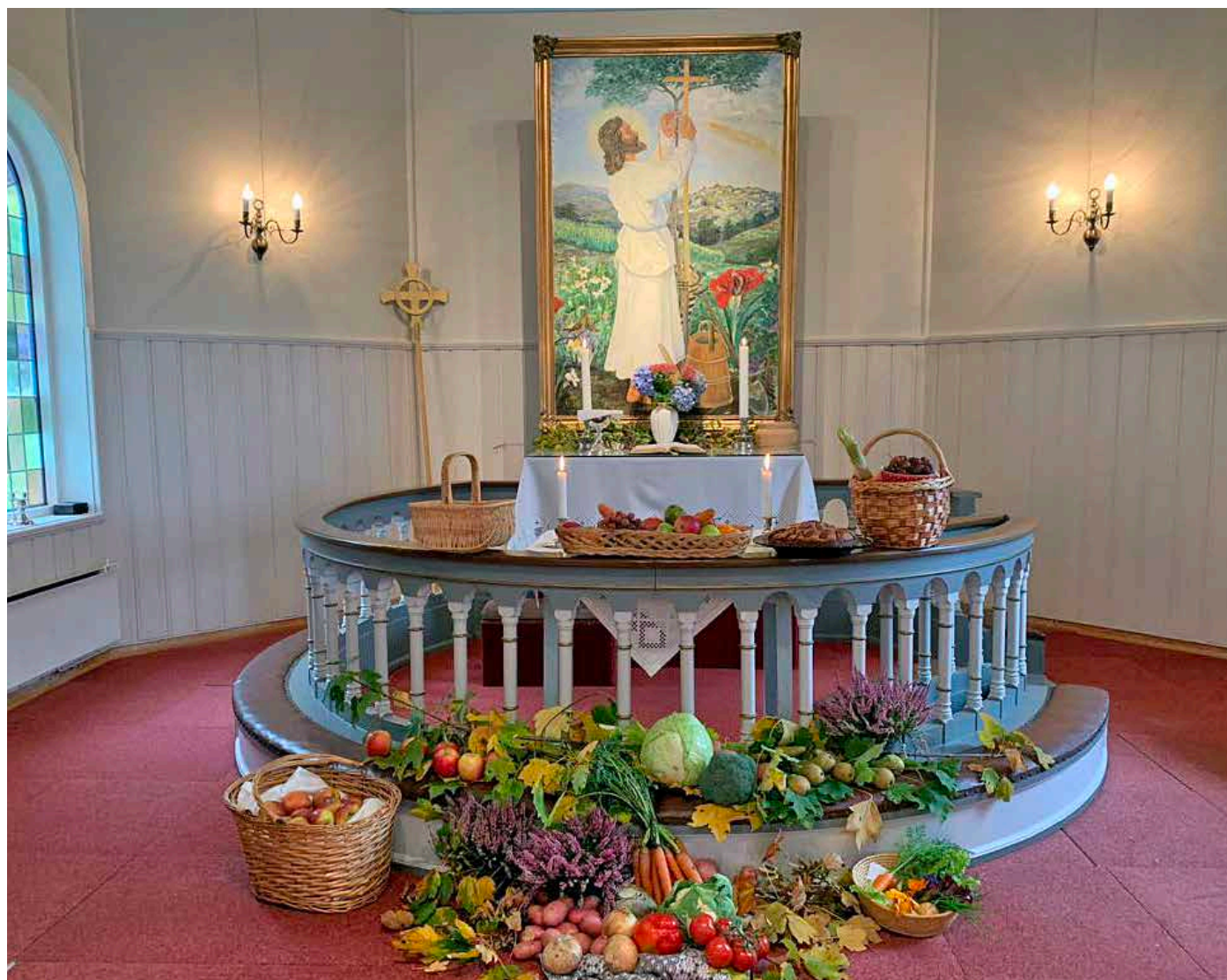
Folkestad kapell pynta til hausttakkefesten)