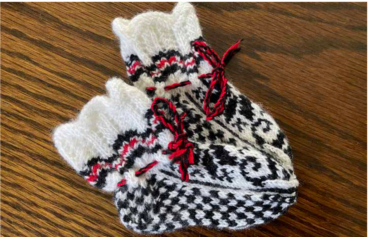
Åtteblad-rose er tradisjonsmønster i norsk strikkekunst, så kvifor ikkje til nye sunnfjordingar.

I Dale har laget skipa til vårfest og juletreffar, og dei har hatt baking med utviklings- og funksjonshemma, dei har skipa til mange kurs mellom anna i flatbrød-, potetkake- og lefsebaking, og dei har markert seg med stand på Dale-Dagane og selt kaker og rømmegraut, for å nemne noko av aktiviteten.