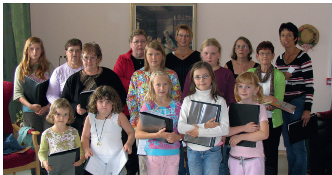
Familiekoret på tur til Solund i 2005

koret, og vi har sidan vore eit barne- og ungdomskor. Koret er avgjerande for gudstenestelivet og trusopplæring i Guddal og har gitt songglede til mange gjennom åra.