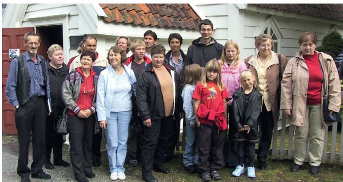
Guddal familiekor med familiemedlemar på tur til Voss og Vik i 2002, her ved Undredal Stavkyrkje.

koret, og vi har sidan vore eit barne- og ungdomskor. Koret er avgjerande for gudstenestelivet og trusopplæring i Guddal og har gitt songglede til mange gjennom åra.