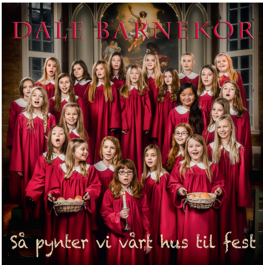
Foto: David Zadig, frå CD-en innspelt av Dale Barnekor, som vi deler ut til 6-åringane kvart år.

«Det er ikkje dei friske som treng lege, men dei som har vondt. Eg er ikkje komen for å kalla rettferdige, men syndarar.» (Mark 2, 17).