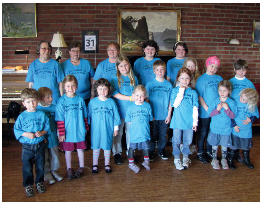
Guddal familiekor har konsert på Fjaler sjukeheim kvart år, her i 2011.