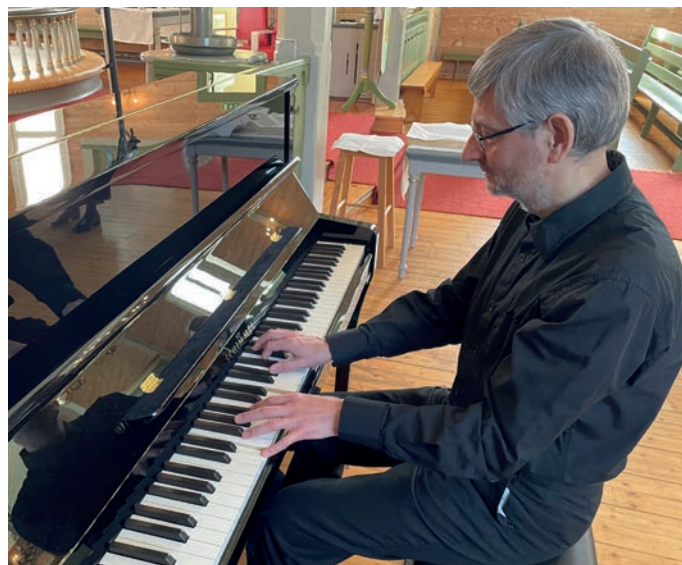
Det nye konsertpianoet i Dale kyrkje.