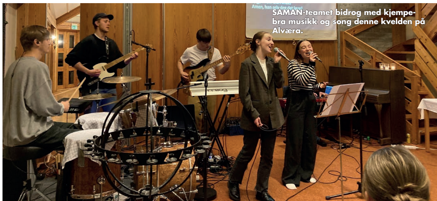
SAMAN-teamet bidrog med kjempebra musikk og song denne kvelden på Alværa.

Det var mat og ulike aktivitetar, og samlinga blei avslutta med ei flott gudsteneste med band og forsongarar.