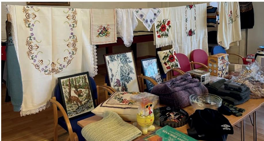
- Det står stor respekt av alt det fine handarbeidet som vart loddta ut. Både strikkepinnar, sy og heklenåler heldt stø kurs fram mot basardagen. Og resultatet vart godt. Også dei som ikkje vann, støtta ei god sak. Det er ein gevinst det óg!