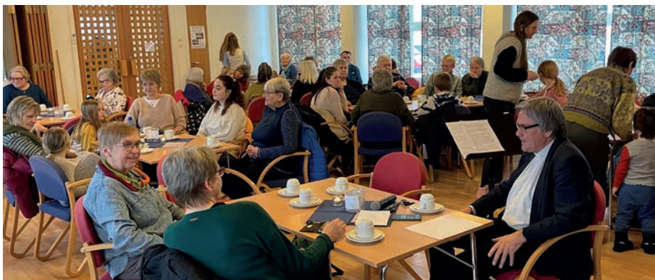
- Kring 70 store og små var sessa ved borda på basaren, og dei fekk servert eit godt kakemåltid, midtvegs i åresalet. Basar er kjekt, og viktig, ikkje minst på Ljosheim.