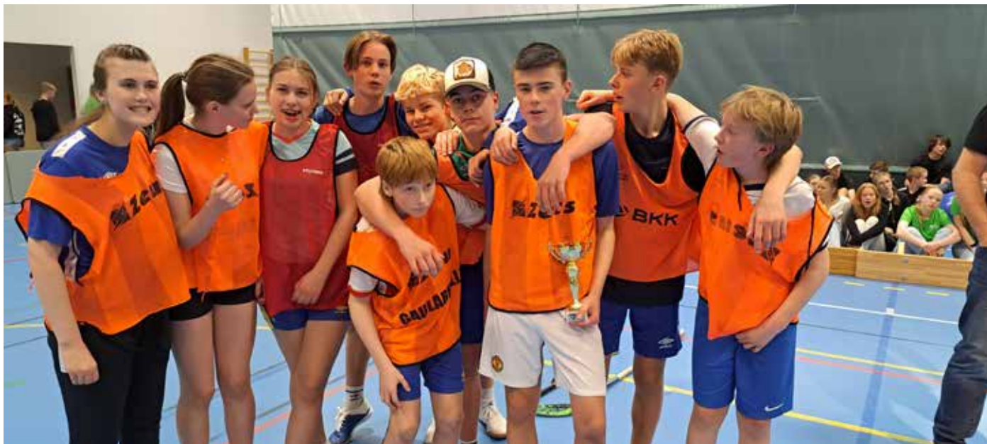
Fjaler sitt vinnarlag vann knepent over det andre laget frå Fjaler i finalen.