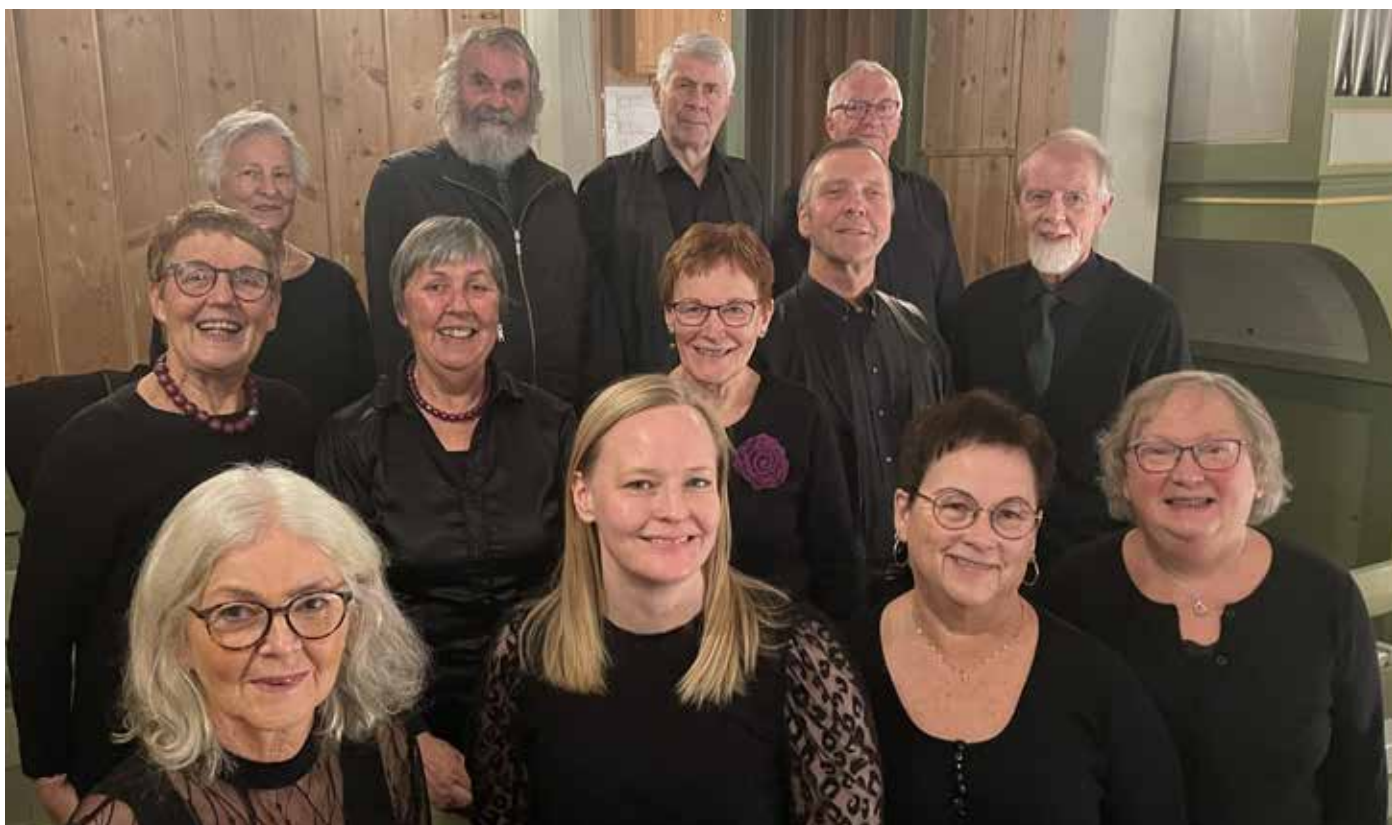
Som kyrkjeor har Cantus og orgelet følgt kvarande i alle desse 40 åra. Denne kvelden var koret noko amputert, men bidrog godt.