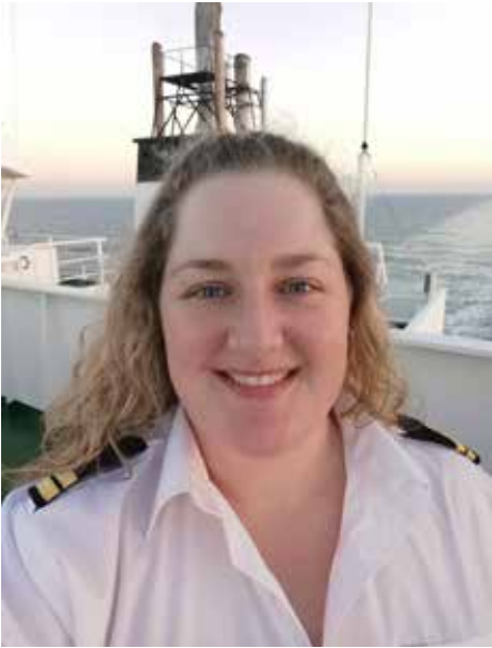
Overgangen frå brua på kjemikalietankarar verda rundt til kyrkjekontoret i Dalstunet er stor, men der er også likheitstrekk.