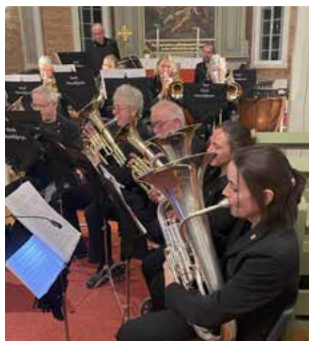
Dale Musikkorps for første gong med pauker, på lån frå Førde.