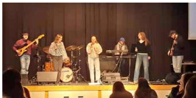
Eit band frå Bergen laga show under festivalen, og tok med konfirmantane på enkel dans og allsong.

Konfirmantane var med på ulike aktivitetar som dei hadde valt sjølv, mellom anna dans, drama, kajakk, bading og førstehjelp. Det blei arrangert ei innebandyturnering der begge Fjaler sine lag møtte kvarandre i finalen, ein sær god prestasjon då mange lag frå Sunnfjord og ytre Sogn deltok.