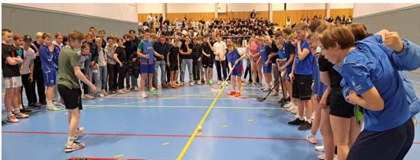
Vinnarlaget frå Fjaler vann på straffeslagkonkurranse i semifinalen.

For andre gong blei Konfirmantfestivalen arrangert i Sunnfjord. Festivalen gjekk av stabelen laurdag 28. oktober i Gaularhallen på Sande, og 473 konfirmantar deltok. Eit musikkband frå St. Jakob kyrkje i Bergen laga show.