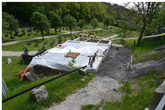
Grøfter til energibrønner og varmeanlegg er ferdige ned til uthuset som skal bygges om til teknisk rom og lager. Her er gulvet støpt og nå står gjenreising av et ny bygg for tur.