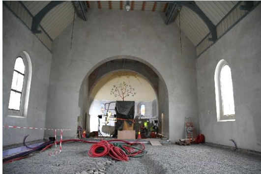
Ny oppbygging av kirkegulvet pågår.