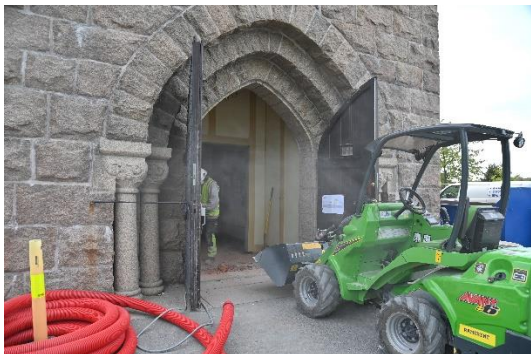
Gulvet i våpenhus pigges ut og klargjøres for ny oppbygging.

Foreløpig er fremdriften forlenget fra september til førsten av desember 2020, da omfattende skader må utbedres. Det er mange fagområder som skal koordineres og arbeidene går fint fremover.