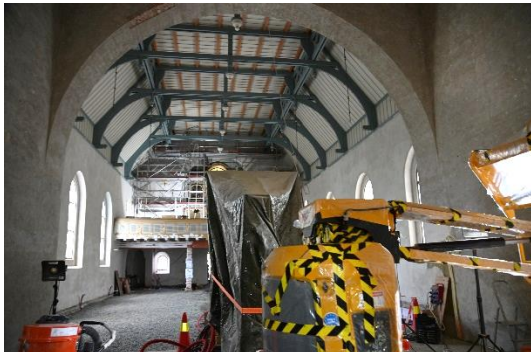
Omfattende pusskader i koret/apsis, skip, galleri og tårnrom utbedres.