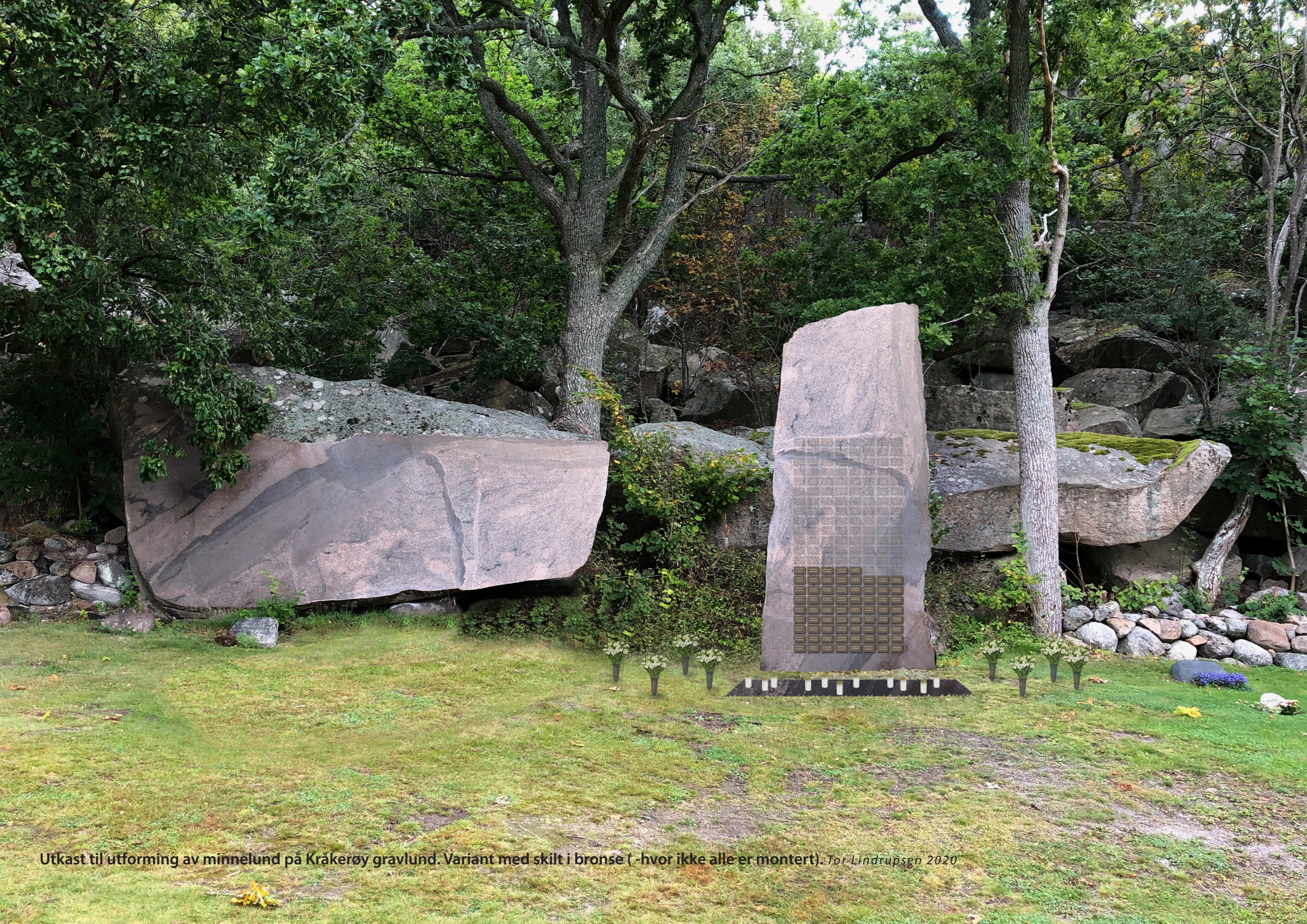
Utkast til utforming av minnelund på Kråkerøy gravlund. Variant med skilt i bronse (-hvor ikke alle er montert). Tor Lindrupsen 2020