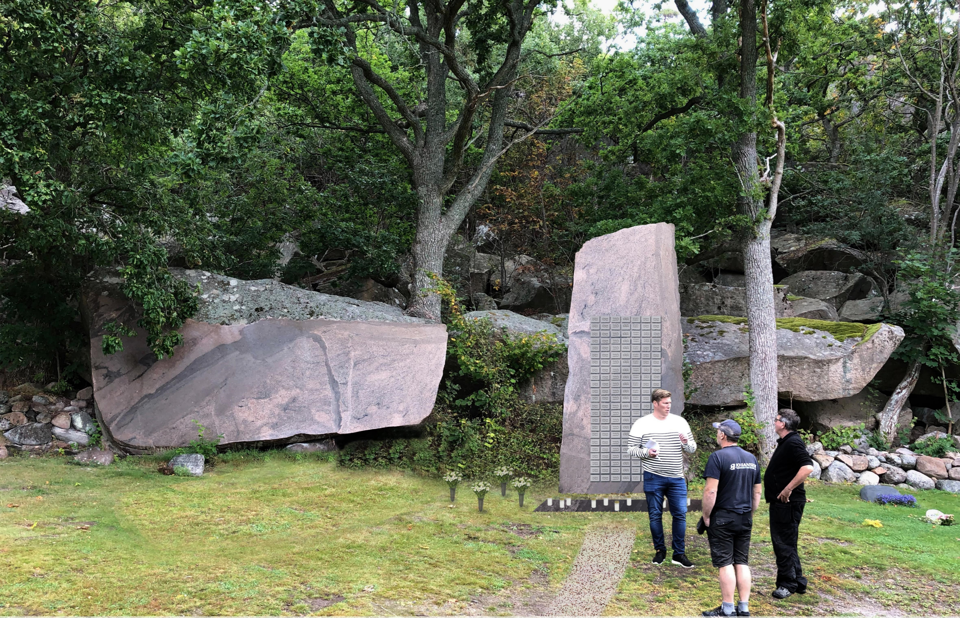
Utkast til utforming av minnelund på Kråkerøy gravlund. Variant med sti og folk som viser størrelser. Tor Lindrupsen 2020