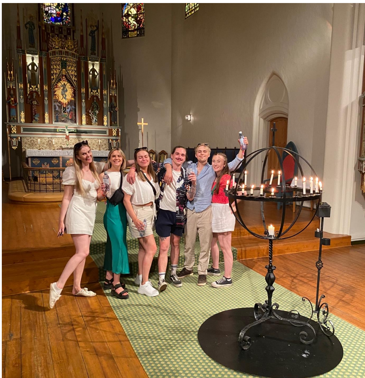
Bilde fra åpen kirke under Idyll-festivalen, hvor domkirken holdt åpent slik at ungdommene kunne få drikke vann, ladet mobilene sine og tenne lys. Flere ansatte var til stede slik at de som trengte det også kunne få noen og prate med. Over 600 kom innom domkirken under festivalen.