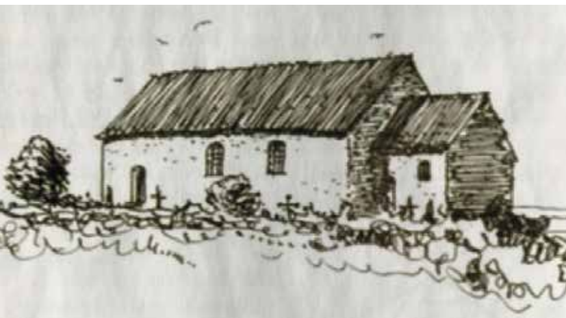
Tegning av antatt første Borge middelalderkirke, slik Ivar Bruu tenkte seg den.

Oldsaker var det lite av. Det ble funnet mest rester etter knuste leirkar. I en grav lå det likevel noen få smykkesaker av jern og bronse. Det var en halsring og to spenner. Det siste ble brukt til å holde klesdrakten sammen over brystet. Dessuten var det deler av et belte med jernspenne. Det som er interessant ved disse tingene, er at de kan tidfestes til omkring Kristi fødsel, og altså er like gamle som noen av praktfunnene fra Hunn. En annen ting er at de gir visshet for forbindelse med Bornholm, for