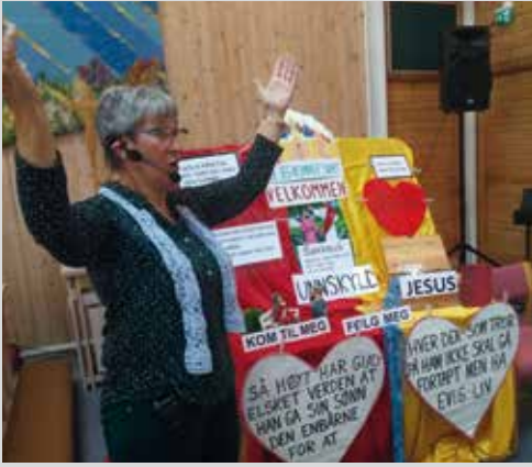
Fra lørdagskafeens jubileumsfest.