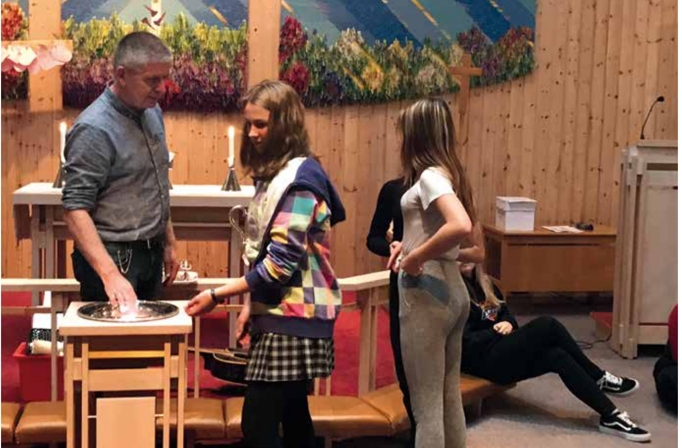
Prest Tore gir nye konfirmanter føling med dåpsvannet.