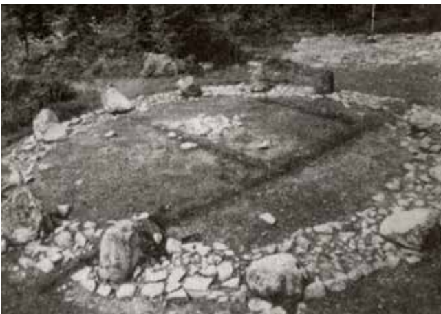
Bildet fra utgravingen av Hunnfeltet på 1950-tallet.

Vi antar at det eldste kirkebygget er fra siste del av 1100 og var bygget av gråsten, og at kirken hadde et rektangulært skip med smalere rett avsluttet kor.