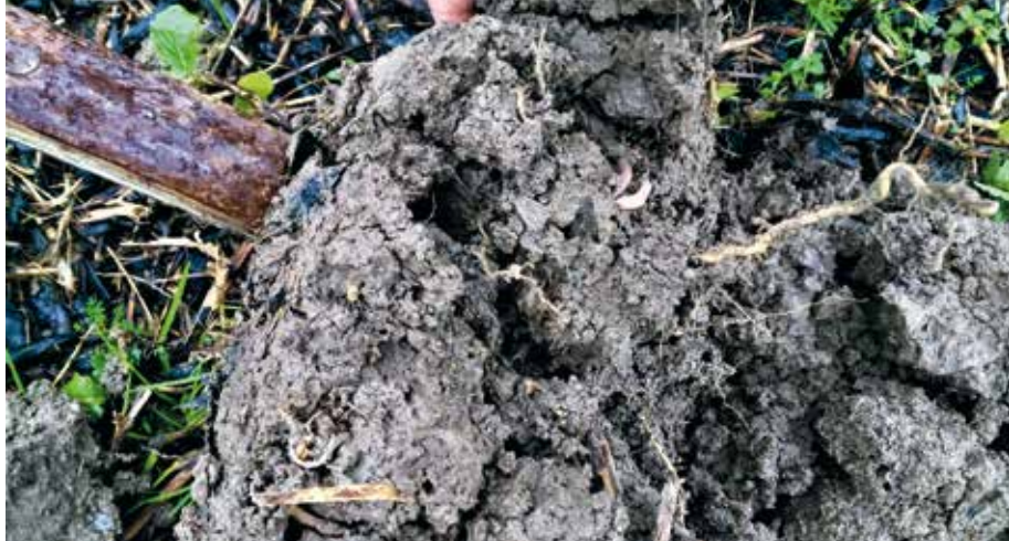
Bønner gir porøs jord med mye meitemark.