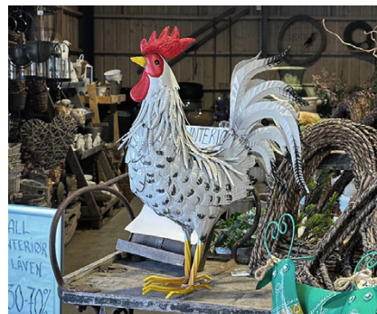
Hanefar i rustikke omgivelser.