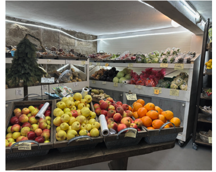
Bredt utvalg i frukt og grønt.