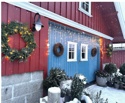
Påbygg fra tidligere potetkjeller.