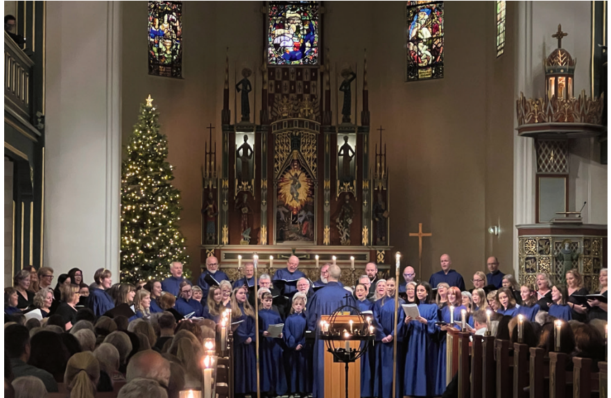
Denne julen samlet «Ni lesninger og sanger» hele 650 mennesker i Domkirken.