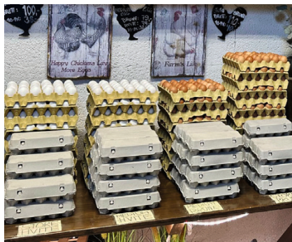
Egenproduserte egg i butikken.