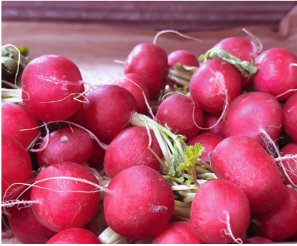
Friske og velsmakende reddiker.