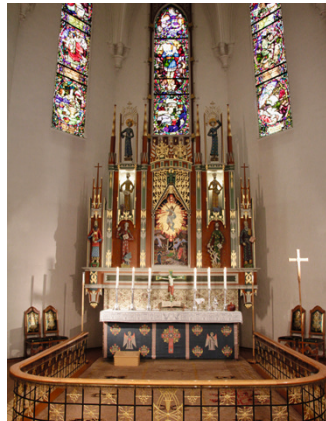
Domkirken har gudstjenester hver søndag kl 11.00.

Her er QR-koden som viser vei til Glemmen og Gamle Glemmen menigheter.