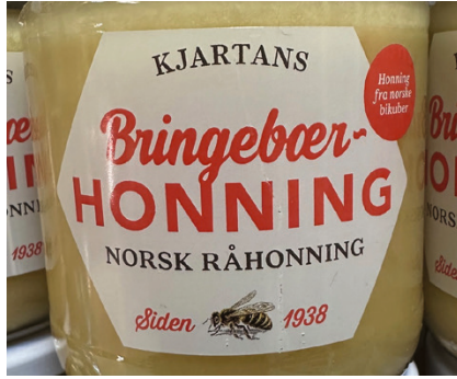
Honning fra norske bikuber.