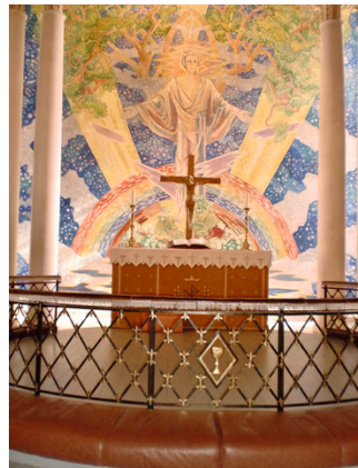
Glemmen kirke har gudstjenester hver søndag kl. 11.00.