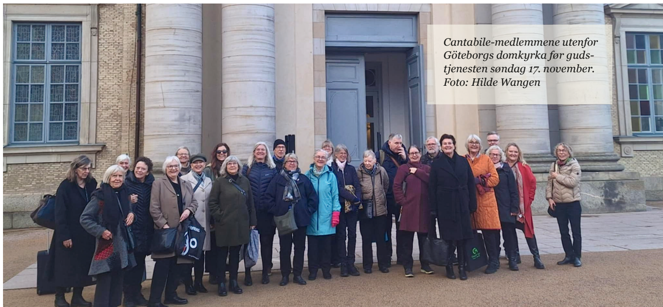
Cantabile-medlemmene utenfor Göteborgs domkyrka før gudstjenesten søndag 17. november.