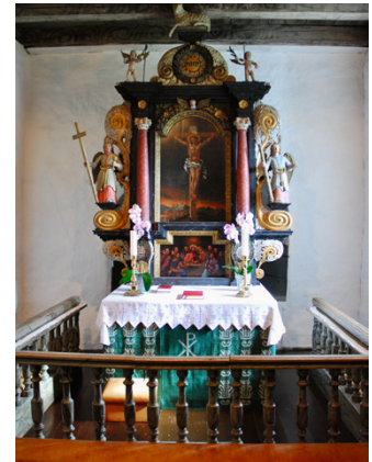
Gamle Glemmen kirke har gudstjenester annenhver søndag kl. 11.00.

E R DET NOEN som lurer på hvor de tradisjonelle «prekenlistene» i menighetsbladet har blitt av?