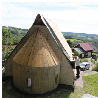
«The Apple Chapel» på Soli, etter inspirasjon fra middelalderkirker.