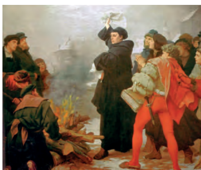
Luther river i stykker pavens bannbulle

Hva vil det si å være luthersk i dag? Kortsvaret er at det handler om det samme i dag som for 500 år siden. Reformasjonen reiste nemlig det sentrale spørsmålet: Hva handler kristendom om? Hva er det sentrale i kristendommen? Luther leverte sine slagord som sin sammenfatning: nåden alene, Kristus alene, troen alene, bibelen alene. Disse slagorda sier lite for mange mennesker i dag. Om vi skal sammenfatte hva som er sentralt, vil vi kanskje si: Det er trekløveret: tro, håp, kjærlighet.