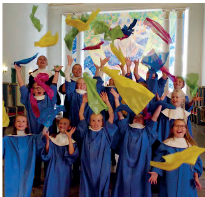
Barn er et viktig satsingsområde i Glemmen.

Som et resultat av dette arbeidet er det utarbeidet en MUV-plan for Glemmen, som ble vedtatt i menighetsrådet 28.9. Denne er laget på bakgrunn av konkrete forslag og synspunkter hentet inn fra