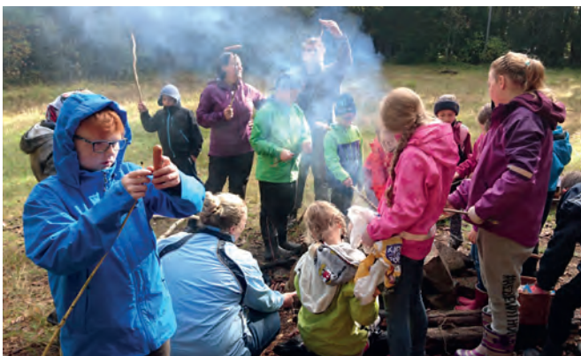
Grilling i høstferien.

« Kor-Tror » er arbeidsnavnet for et tettere samarbeid mellom kor- og tror-virksomhetene i Glemmen. Allerede ved høsttakkefesten i Glemmen kirke medvirket familiekoret som er satt sammen av Minores, småbarnsang og deres foreldre/besteforeldre.