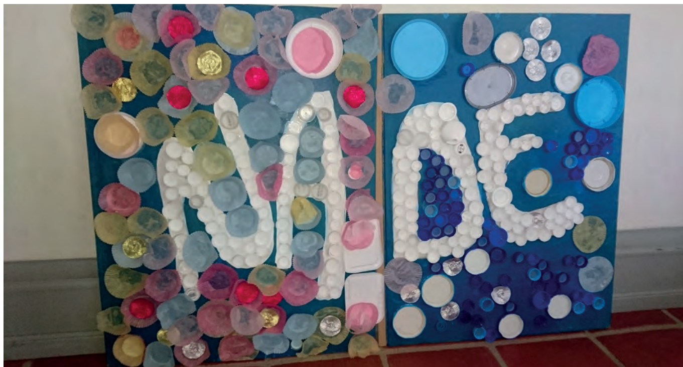
Barn som deltok på opplegget før skolestart laget dette bildet av "Nåde".