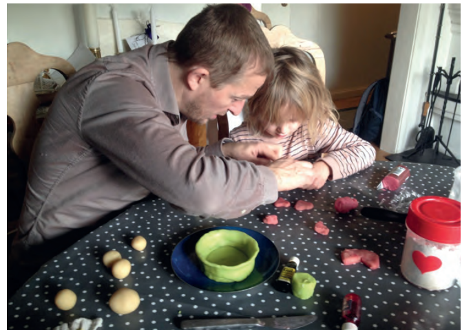
Det er fint å lage adventspynt sammen med barna.

vokser og gror. Stjerne i vinduet, og en 7 armet lysestake som lyser ut i vintermørket - betlehemsstjernen som skinte over krybben, og 7 tallet som går igjen i mange sammenheng i bibelen. Nå når så mye foregår med en telefon i hånden og på nett, er det viktig at vi bruker våre hender! Det er en ferdighet som vi må ta vare på og som adventstiden gir oss gode muligheter for å praktisere.