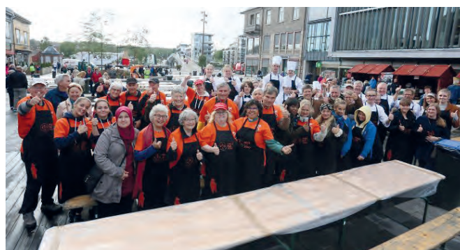
Frivillige fra menighetene, Bymisjon, kokkelinja på Glemmen vgs. m.fl. serverte reker til 2000.

Stortorget ble arenaen 12. september, selve jubileums-dagen. Sponsorer ble kontaktet for vi trengte bord og benker til 1200 mennesker og 1000 kilo med reker! Du har sikkert både lest og hørt om den store rekefesten som ble holdt på Stortorget 12. september, men jeg håper du la merke til en gjeng på 20 stykker med oransje t-skjorter og svarte forklær, som med smil om munnen serverte nesten halve Stortorget med både reker og tilbehør, og delte ut over 500 kopper med kaffe. For en gjeng!