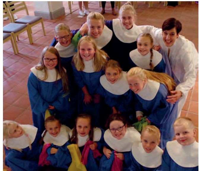
Elevene får være med i kor og synge i kirken.